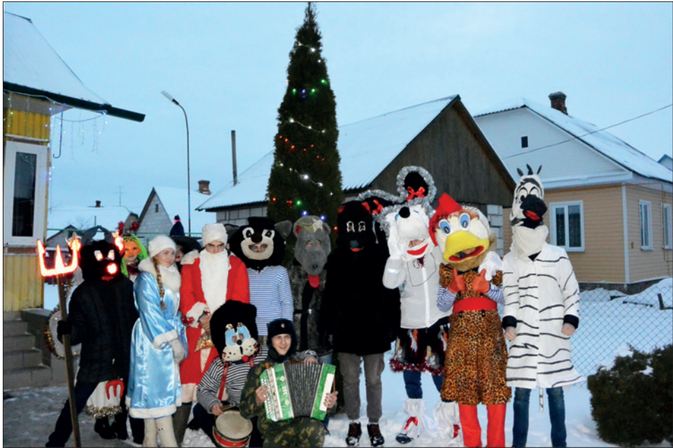
Адна з груп „Конікаў” у Давыд-Гарадку 13 студзеня 2017 г.

s. 321–322). Аўтарка гэтага тэксту апісала „Конікаў” пасля выезду ў Давыд-Гарадок у 2017 г. (Leshkevich, 2022, s. 33–34) і прасачыла трансфармацыю абраду, параўноўваючы яго з „хаджэннем з казой” на Куявіі (Leshkevich 2023b).