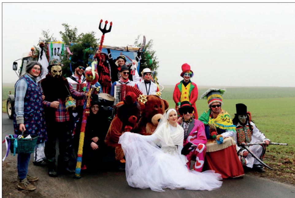
Група пераапанутых Koza Florianowo 10 лютага 2024 г.

Хаця „хаджэнне з казой” на Куяві адбываецца на Запусты, а шчадраванне „Конікі” ў Давыд-Гарадку – напярэдадні Старога Новага года, гэтыя звычэй тыпалагічна блізкія, бо іх аснову складае абыход двароў пераапанутымі персанажамі як частка абраду пераходу у тэрміналогіі Арнольда Ван Генэпа (1909), і таму параўнанне іх асвятлення ў медыя абгрунтаванае. У абодвух выпадках абыходы праходзяць спантанна, без умяшальніцтва работнікаў культуры, хаця праводзяцца і арганізаваныя „зверху” мерапрыемствы: у выпадку Куяві гэта гмінныя прагляды запустных гуртоў у Тапульцы, Ізбіцы Куяўскай і Любраньцы, а таксама шэсце ва Ёлацлаўку, а ў Давыд-Гарадку – канцэрт з дыскатэкай на Цэнтральнай плошчы і конкурс на лепшага „коніка”. У абедзвюх даследаваных мясцовасцях да традыцыйных персанажаў у гуртах пераапанутых дадаюцца новыя. Абудва элементы ўнесены ў нацыянальныя спісы НКС у 2020 г.