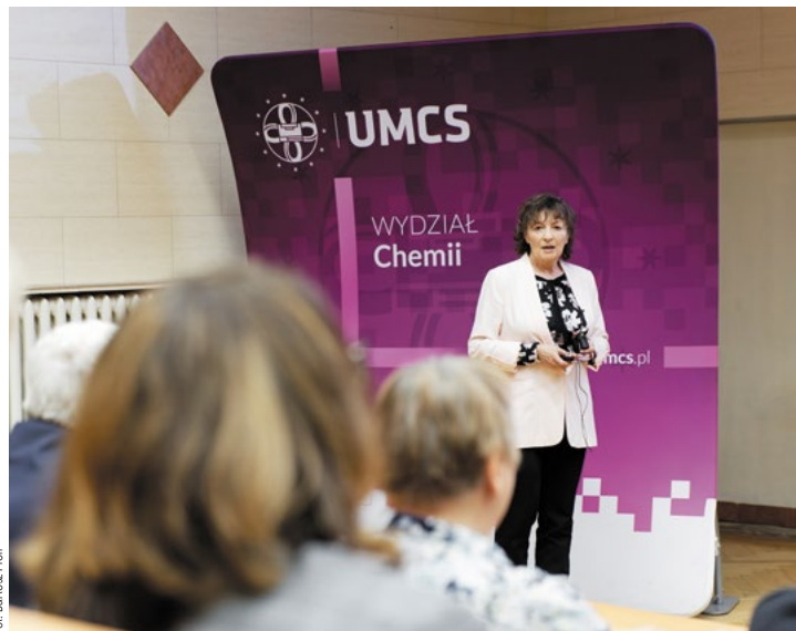
Fot. Barłose Proll