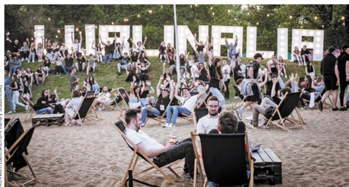
Archiwum Lubelskich Dni Kultury Studenckiej

Studenckiej zapewniają wszystkim zakom niepowtarzalną okazję do tworzenia niesamowitych wspomnień!