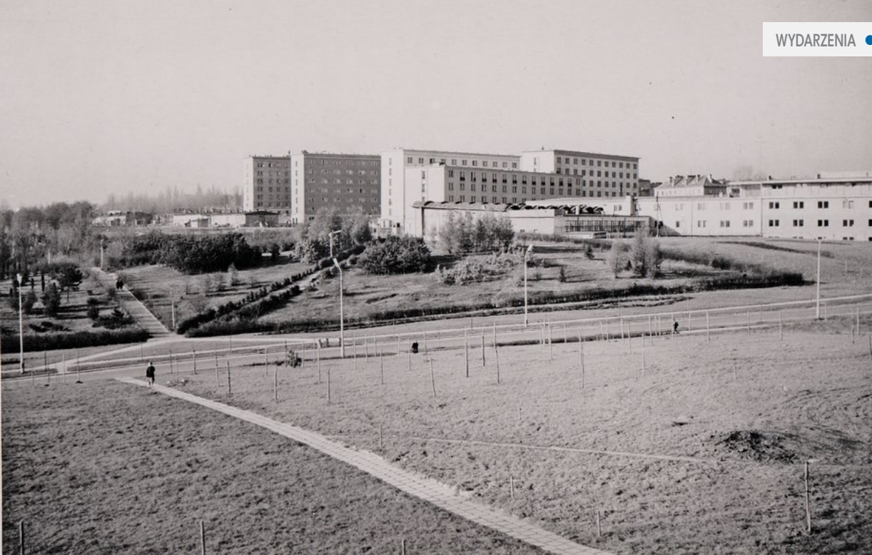
← Park Akademicki od strony ul. Sowińskiego (1964 r.)

w lecie 1950 r. władze dziekańskie Wydziału Matematyczno-Przyrodniczego alarmowały Rektora UMCS, że budżet Wydziału jest nadmiernie obciążony tymi wydatkami i zaproponowały, by ze wszystkich wydziałów zabezpieczyć dla ogrodu po 500 tys. zł, a także żeby począwszy od 1952 r. ogród został jednostką organizacyjną UMCS z własnym budżetem.