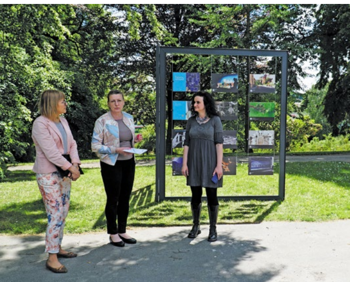
Archiwum Ogrodu Botanicznego UMCS Archiwum Ogrodu Botanicznego UMCS