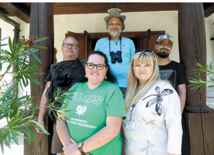
Archiwum Wydziału Biologii i Biotechnologii