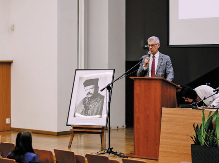
Fot. Cezary Rein