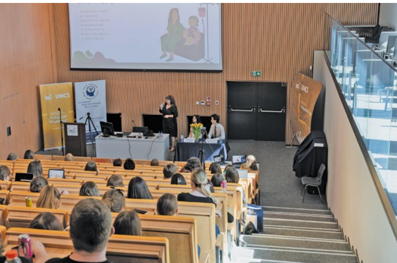
Fot. Cezary Mańturzyk