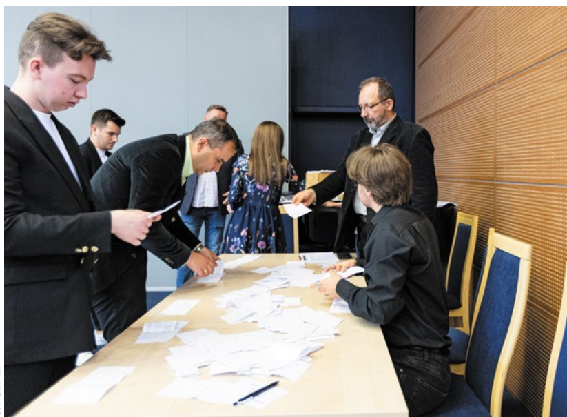
Fot. Michał Piłat