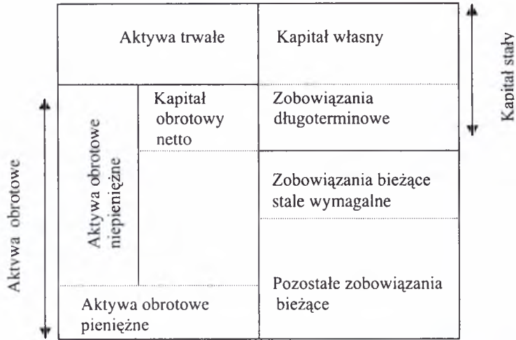
Ryc. 3. Struktura kapitałowo-majątkowa przedsiębiorstwa The capital-assets structure of a company