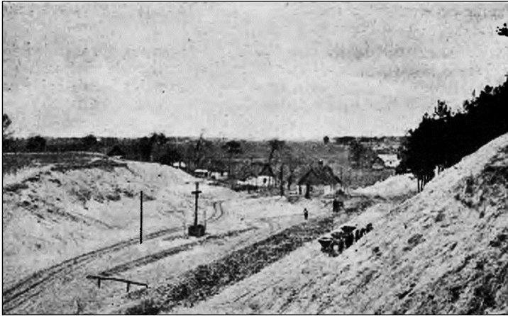
Ryc. 2. Budowa drogi w okolicach Mielca prowadzącej do Państwowych Zakładów Lotniczych.