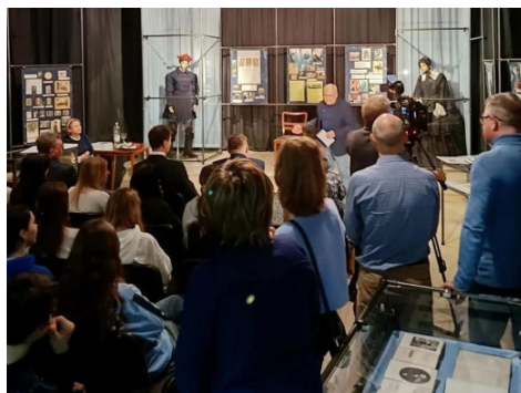
Fot. 3. Wernisaż wystawy „Szembekowie i Fredrowie w Dziejach Polski”.