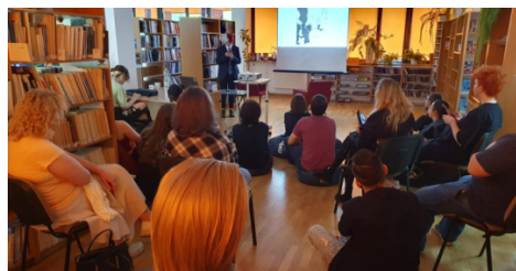
Fot. 4. Spotkania z mangą i anime.