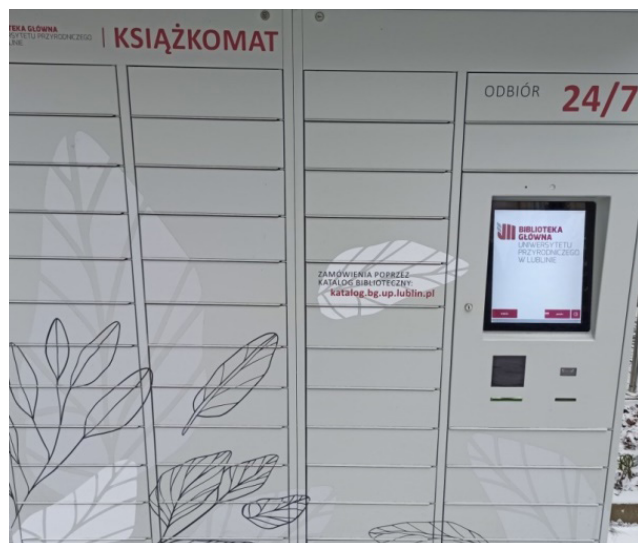
Fot. 13. Książkomat Biblioteki Uniwersytetu Przyrodniczego w Lublinie.