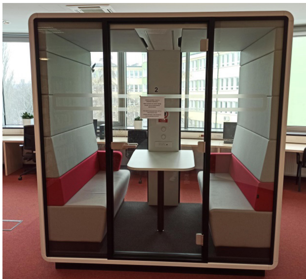
Fot. 2. Kabina multimedialna – Biblioteka Uniwersytetu Przyrodniczego Lublin. Źródło własne.

Biblioteki w XXI w. na nowo definiują swoje funkcje w odpowiedzi na zmieniające się potrzeby użytkowników i rozwój techniki. Jej rola nie ogranicza się już tylko do zbierania i udostępniania książek, lecz obejmuje także bycie centrum innowacji, edukacji i integracji społecznej. Biblioteki stały się instytucjami świadczącymi usługi na rzecz swoich czytelników 18 , których potrzeby sprawiają, że biblioteka staje się miejscem pełnym kulturalnym wydarzeń. Dziś biblioteka to także czytelnicy, spotkania oraz integracja. Zainteresowaniem czytelników cieszą się festiwale książek, spotkania miłośników komiksów, spotkania z autorami, miłośników literatury, wykłady czy warsztaty. W Bibliotece Głównej UMCS w Lublinie organizowane są różne wydarzenia kulturalne, tj.: spotkania z mangą i anime dla miłośników komiksów, spotkania miłośników literatury, wykłady Stowarzyszenia Miłośników Dawnej Broni i Barwy, wieczorki poetyckie, warsztaty dla dzieci.