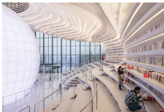
Fot. 11. Biblioteka Binhai w Tianjin

Przykłady te pokazują, jak bardzo innowacyjne potrafią być budynki biblioteczne łączące funkcjonalną architekturę, estetykę i zaawansowaną technologię. Widoczne jest tworzenie miejsc przyjaznych czytelnikowi, sprzyjających nauce i integracji społecznej. Biblioteki tym samym odpowiadają na zmieniające się potrzeby społeczeństwa i rozwój technologiczny.