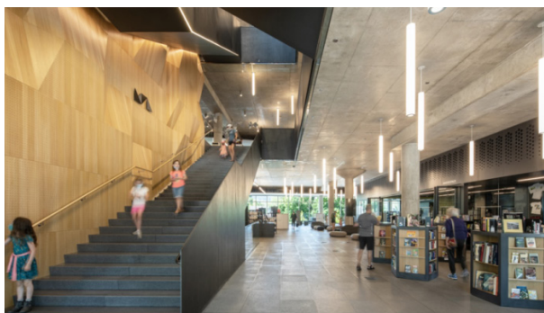
Fot. 8. Missoula Public Library.

Kolejną biblioteką stworzoną z myślą o przyszłych czytelnikach jest amerykańska biblioteka publiczna Missoula, która w 2022 r. otrzymała nagrodę dla najlepszej biblioteki (Public Library of the Year Award) przyznawaną przez Międzynarodową