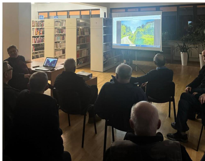
Fot. 5. Wykład Stowarzyszenia Miłośników Dawnej Broni i Barwy.