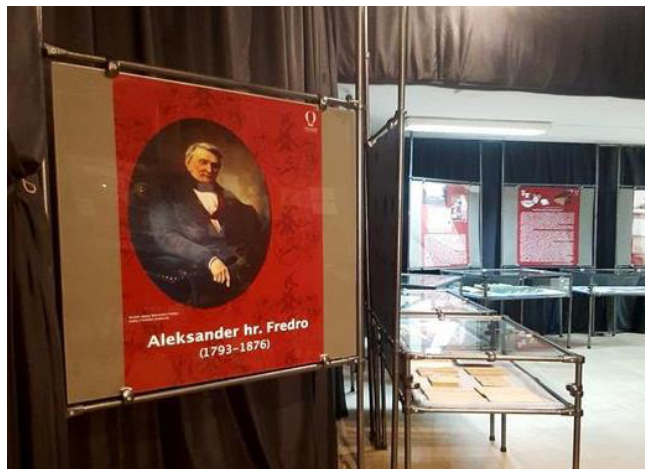
Fot. 6. Wystawa Aleksander hr. Fredro – polski Molière. W 230. rocznicę urodzin.