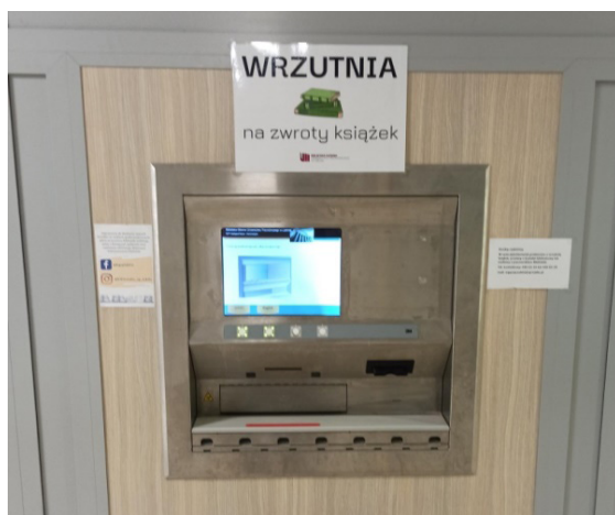
Fot. 12. Wrzutnia Biblioteki Uniwersytetu Przyrodniczego w Lublinie.

większej ilości informacji niż przy tradycyjnych kodach. Etykiety RFID umożliwiają odczytanie danych bez konieczności ściągnięcia książki z regału, lokalizują źle odłożone egzemplarze oraz zabezpieczają przed kradzieżą. System automatycznej identyfikacji RFID zapewnia szybsze i wydajniejsze zarządzanie zbiorami bibliotecznymi.