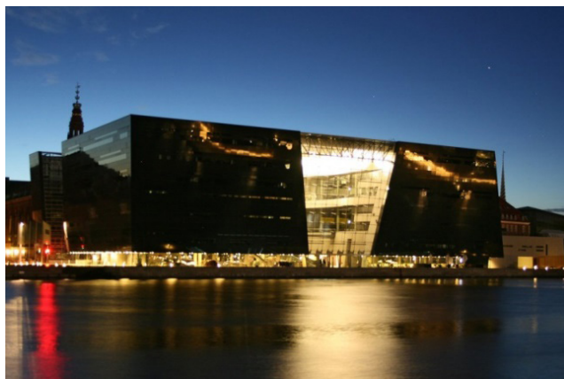
Fot. 7. Biblioteka Królewska w Kopenhadze.

W XXI w. nowo wybudowane budynki biblioteczne stały się przykładami nowoczesności, łącząc tradycyjne funkcje z innowacyjnymi rozwiązaniami technologicznymi i architektonicznymi. Jedną z najnowocześniejszych bibliotek w Europie jest Biblioteka Królewska w Kopenhadze powszechnie nazywana „Czarny Diament” ze względu na charakterystyczną elewację z czarnego granitu. Budynek znajduje się