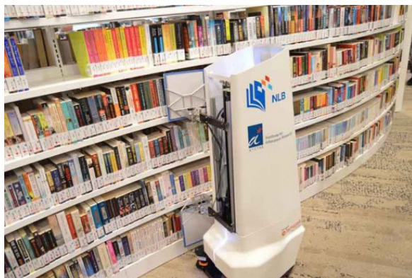
Fot. 14. Robot AuRoSS.

Rozwój technologii ma za zadanie ułatwienie pracy. Do czasochłonnych prac wykonywanych w bibliotece, takich jak inwentaryzacja czy weryfikacja tego, czy książka znajduje się we właściwym miejscu na regale, wykorzystuje się roboty magazynowe. Przykładem takiego robota jest wynaleziony przez singapurskich naukowców AuRoSS ( Autonomous Robotic Shelf Scanning System ). Robot ten samodzielnie przemieszcza się między regałami bibliotecznymi i wykorzystując technologię RFID, skanuje książki, następnie generuje raport o brakujących lub źle odłożonych pozycjach. Według badań robot ten osiągnął poziom dokładności wynoszący 99% 28 .