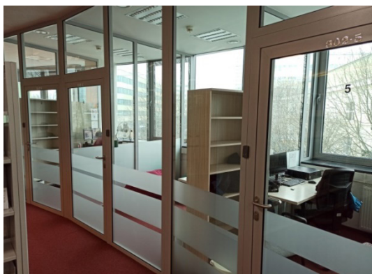
Fot. 1. Pokoje do pracy indywidualnej i grupowej – Biblioteka Uniwersytetu Przyrodniczego Lublin.

sale multimedialne, sale konferencyjne, laboratoria, centra dydaktyczne, kawiarnie czy miejsca relaksu. „Architektura biblioteczna [...], coraz częściej odchodzi od sztywnych podziałów na czytelnie, wypożyczalnię, ale stara się zapewnić przyjazne miejsce do pracy, nauki, odpoczynku, kontaktów społecznych” 13 . Budynki biblioteczne w swoich murach oferują ciekawe miejsca, w których warto przebywać 14 , gdzie można przyjść i miło spędzić czas. Osoba przychodząca do biblioteki nie musi być jej czytelnikiem i korzystać ze zbiorów, może wykorzystać specjalne przestrzenie do relaksu, spotkać się, porozmawiać ze znajomymi, napić się kawy. Użytkownikom biblioteka powinna kojarzyć się z miejscem przyjaznym, dającym poczucie bezpieczeństwa, zachęcającym do spotkań 15 . Współczesne biblioteki są wielofunkcyjne, oferują swoim czytelnikom miejsca nauki, edukacji, kultury, spotkań czy innych form działania 16 . Znajdują się tam strefy nauki, relaksu czy odpoczynku, gdzie można usiąść na pufie czy hamaku i cieszyć się książką. Dla najmłodszych są miejsca zabaw z kryjówkami do chowania się. Jeżeli potrzebujesz miejsca do spotkania ze znajomymi, do tego również jest biblioteka 17 .