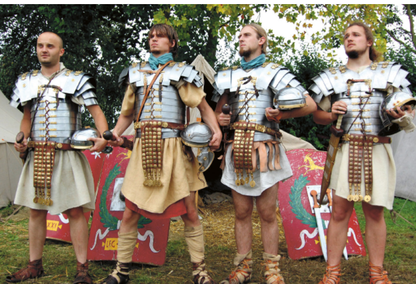
Archiwum Koła Naukowego Amatorów Antyku (sgrzed 2012-)