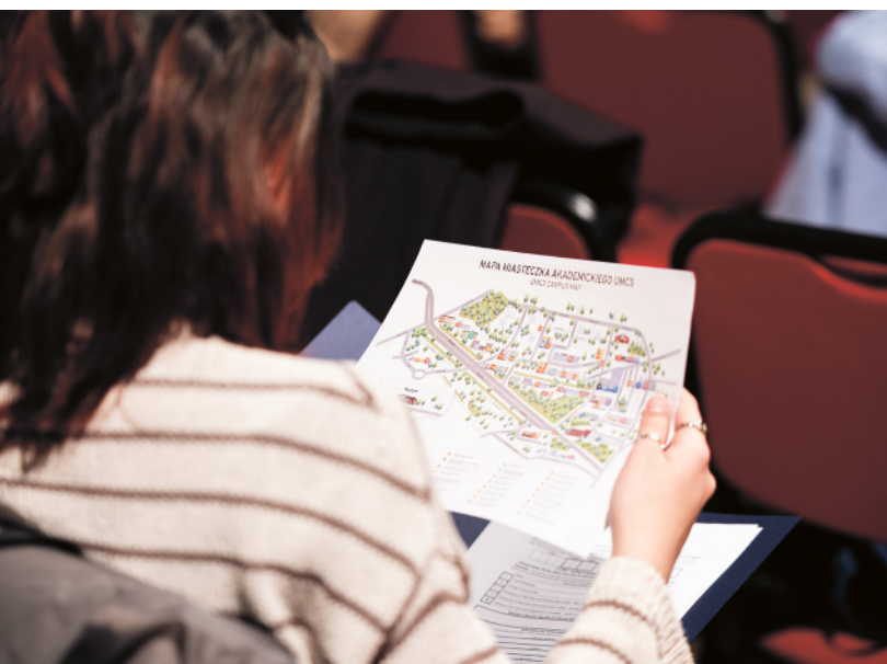
Fot. Michał Piat