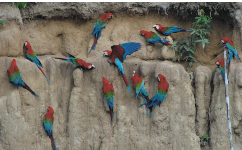
↑ Ara zielonoskrzydła (Amazonia)

Na świecie obserwowanie ptaków jest popularnym sposobem spędzania wolnego czasu. W Stanach Zjednoczonych kilkadziesiąt milionów ludzi (niektóre źródła