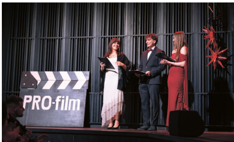
Miejskie stypendia dla studentów i doktorantów UMCS, 4 lutego 2026 r.