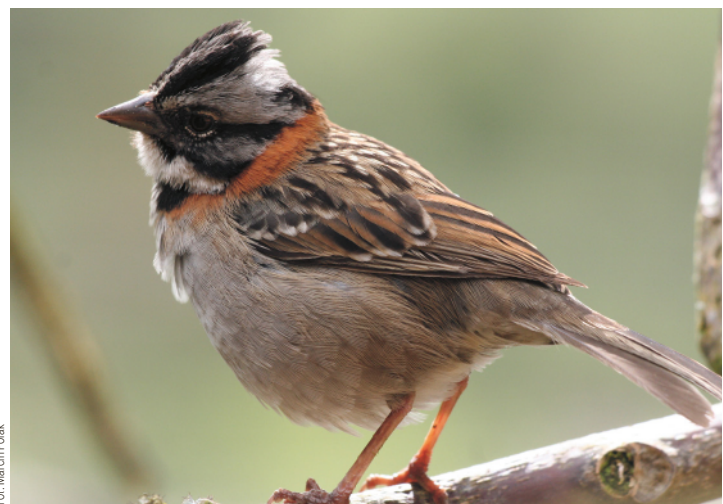
↑ Pasówka obrożna – pospolity ptak z rodziny pasówek (Ekwador)