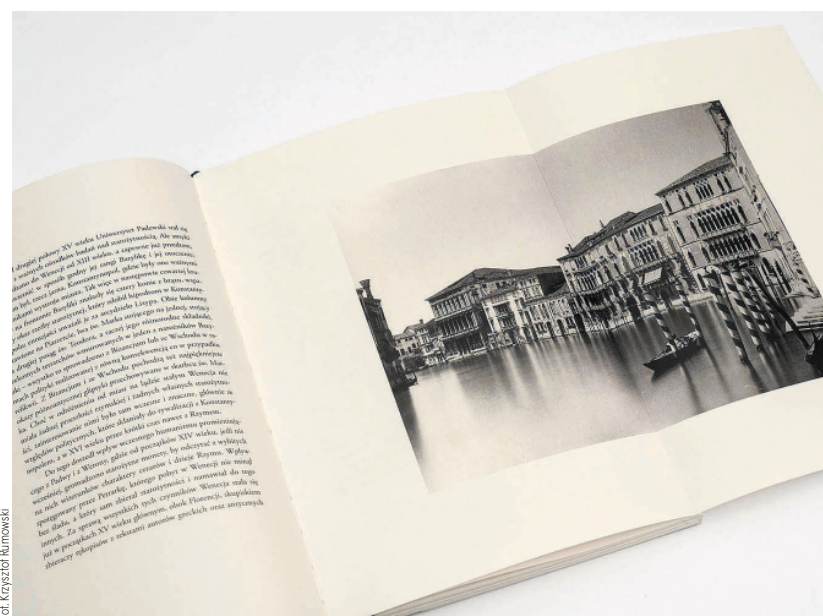
Fot. Krzysztof Burawski

Na pewno mobilizuje do działania. Sprawia, że projektowanie jest bardziej wymagające i prowokuje do poszukiwania nieszablonych rozwiązań. Na przykład kiedy opracowywałem Z Mandelsztama. Siedem wierszy w przekładzie Jerzego Pomianowskiego, wpadłem na pomysł oprawienia książki w stylu japońskim, tzn. karty miały być sznurowane, a nie szyte. Papier ryżowy, którego używa się w tym rodzaju oprawy, jest bardzo miękki i cienki, dlatego każda karta składa się podwójnie. Książka powstała w 2013 r., wtedy w Polsce nie mieliśmy dostępu do japońskich papierów, stąd ten zastosowany jest nieco sztywniejszy. Symboliczne „spotkanie” z dwoma wybitnymi nazwiskami zainspirowało mnie do wykonania projektu, którego efektem było wydanie bibliofilskie.