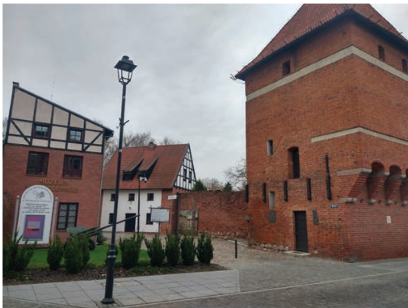
Fot. 1. Kompleks Muzeum Ziemi Kociewskiej przy ul. Bocznej – na pierwszym planie Baszta Gdańska (po prawej) i budynek administracyjno-wystawienniczy (po lewej), w głębi Baszta Narozna