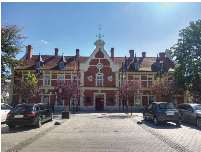
Fot. 2. Budynek Ratusza Miejskiego w Starogardzie Gdańskim