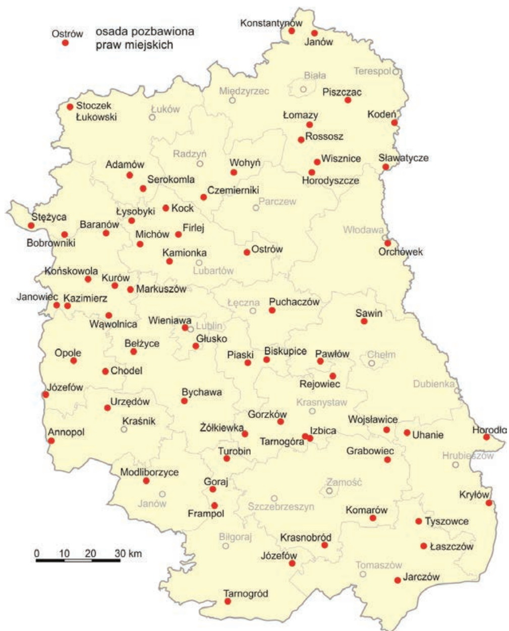
Ryc. 3. Miasta Lubelszczyzny zamienione na osady