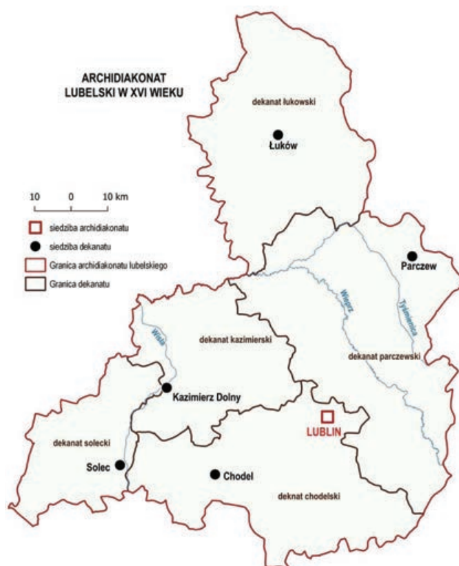
Ryc. 3. Archidiecezja lubelska w XVI wieku