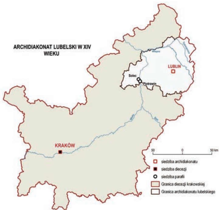
Ryc. 1. Archidiecezja lubelska w XIV wieku