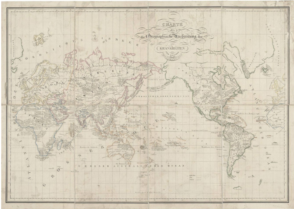
Ryc. 1. Mapa przedstawiająca globalne rozmieszczenie chorób (Schnurrer, 1827, za: Boston Rare Maps) Fig. 1. Map of the global distribution of diseases (Schnurrer, 1827, after: Boston Rare Maps)

zaczęła być kwestionowana. Dynamika zmian w postrzeganiu geografii medycznej wynikała z przełomów w naukach przyrodniczych, rozwoju epidemiologii oraz zmieniających się paradygmatów w naukach społecznych.