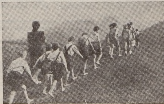
Wspomnienie z lata — Wycieczka w góry kolonii akcji socjalnej Foto A. Cieślak — Kraków