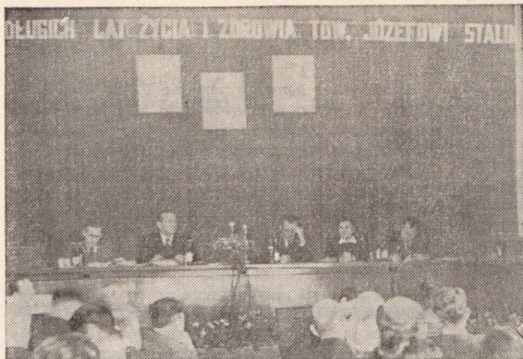
W całym kraju odbyły się uroczyste akademie dla uczczenia 70-lecia urodzin Generalissimusa J. Stalina