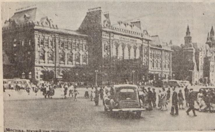
Fragment Stolicy ZSRR — Moskwy

Referat kobiety Zarządu Głównego w planie swych prac przewidział w grudniu br. zorganizowanie pracownic domowych, tak w Warszawie, jak i w terenie. W wyniku tej akcji wstąpiło w szeregi Związku — w Warszawie 2000 pracownic domowych. Przewidywana liczba pracownic domowych w całej Polsce sięga liczby 30.000. Zarządy Okręgów i Oddziałów winny zająć się tą, zaniedbaną a tak opieki wymagającą grupą ludzi pracy.