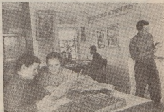
Świetlica w jednym z kolkhozów na Ukrainie