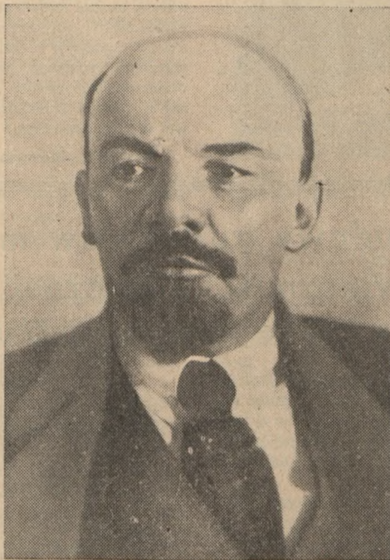
Twórca, Teoretyk i Wódz Partii Bolszewickiej, Wódz Zwycięskiej Wielkiej Rewolucji Socjalistycznej, Twórca Pierwszego Państwa Socjalistycznego.

Towarzysze! My komuniści — jesteśmy ludźmi szczególnego pokroju. Skrojeni jesteśmy ze szczególnego materiału. Stanowimy armię wielkiego stratega proletariackiego, armię towarzysza Lenina. Nie ma nic absolutnie chlubniejszego ponad zaszczyt należenie do tej armii. Nie ma nic chlubniejszego ponad miano członka partii, której twórcą i kierownikiem jest towarzysz Lenin. Nie każdy może być członkiem takiej partii. Nie każdemu jest dane znieść trudy i burze związane z przynależnością do takiej partii. Synowie klasy robotniczej, synowie niedoli i walki, synowie niesłychanych cierpień i bohaterskich wysiłków — oto kto przede wszystkim powinien być członkiem takiej partii. Oto dlaczego partia leninowców, partia komunistów zwie się zarazem partią klasy robotniczej.