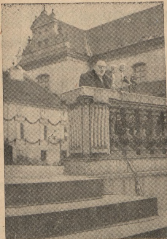
Prezydent R. P. Bolesław Bierut przemawia na uroczystości odsłonięcia pomnika Adama Mickiewicza