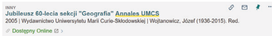
Ryc. 3. Zrzut ekranu katalogu Biblioteki UMCS: przykład artykułu pobranego do PRIMO z Biblioteki Cyfrowej Uniwersytetu Marii Curie-Skłodowskiej w Lublinie.

Central Discovery Index to narzędzie, przeszukujące artykuły z czasopism i rozdziały z książek, materiałów naukowych i akademickich z całego świata (subskrybowane + open access artykuły z czasopism, rozdziały, e-książki, streszczenia, cytowania i inne) 29 . Ustawienia domyślne w CDI nie przeszukują pełnych tekstów, tylko pola metadanych jak w wyszukiwaniu prostym lub zaawansowanym. Przeszukiwanie to daje użytkownikom możliwości korzystania z ogromnych zasobów