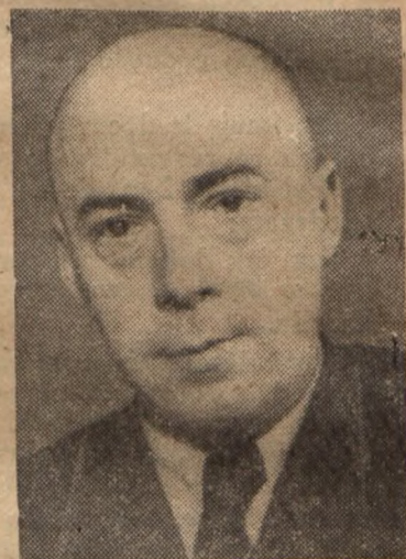
Premier J Cyrankiewicz

OTWARCIE SEJMU. WYBORY PREZYDENTA. NOWY RZĄD POLSKI. ZAPOWIEDŹ AMNESTJI