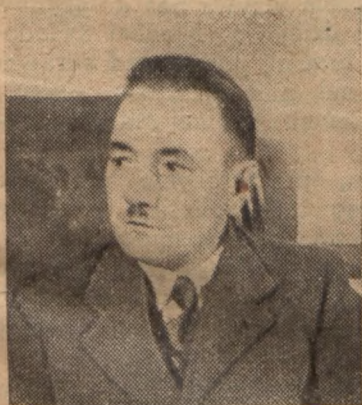
Ob. Bolesław Bierut