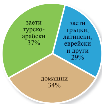
Графика 1. Процентно съотношение на имената в речника според произхода им.