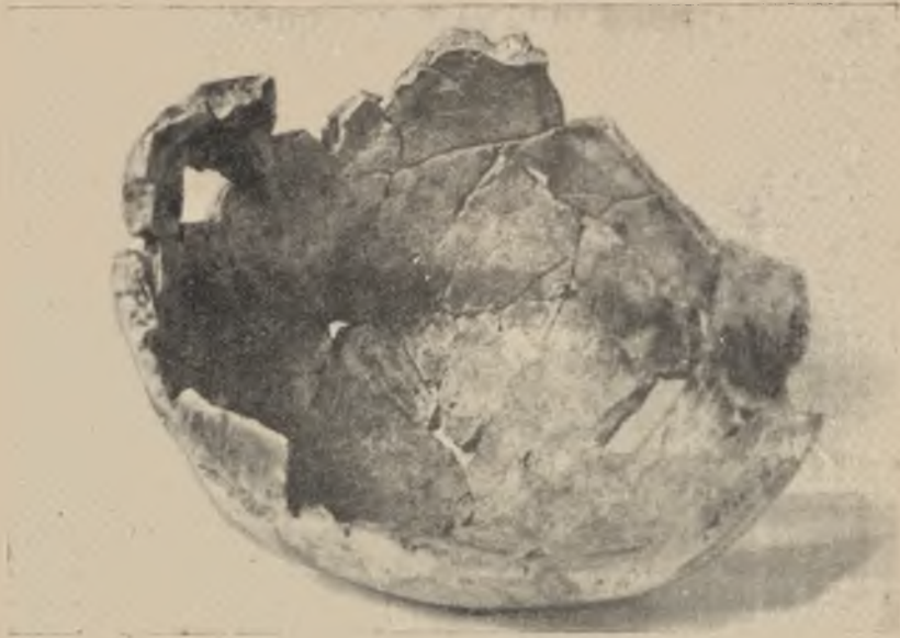
Nr 3. Kalota (dach czaszki) osobnika II od środka (widać wyraźny, przebiegający dookoła całej czaszki pierścień ogniowy).