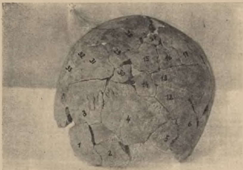
Nr 5. Kalota osobnika II w norma occipitalis .