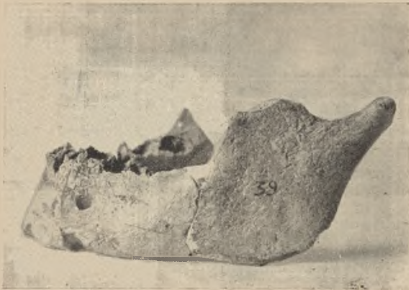
Nr 1. Żuchwa ( mandibula ) osobnika I, (widać wielką szerokość gałęzi ( ramus mandibulae ), niewielkie wcięcie ( incisura ) i otwór bródkowy ( foramen mentale )).