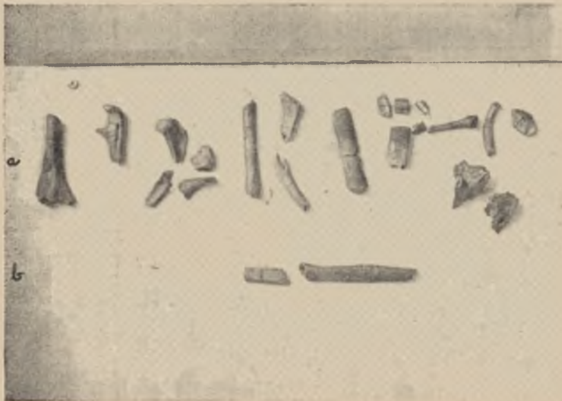
Nr 2. Niektóre większe kawałki kości tułowia i kończyn osobnika I (a) i osobnika III (b).