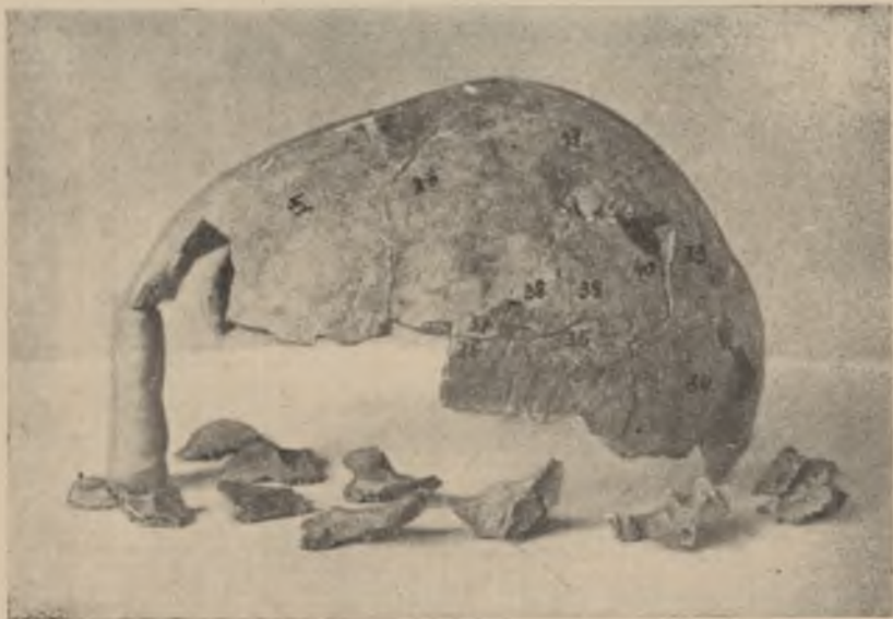
Nr 4. Kalota osobnika II w norma lateralis (obok leżą odłupane kości podstawy czaszki).