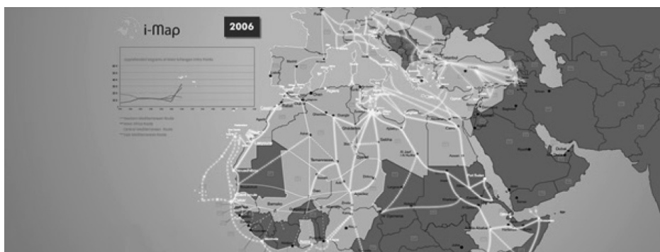
Fig. 2. L'évolution de la migration en Méditerranée après le printemps arabe – 2006