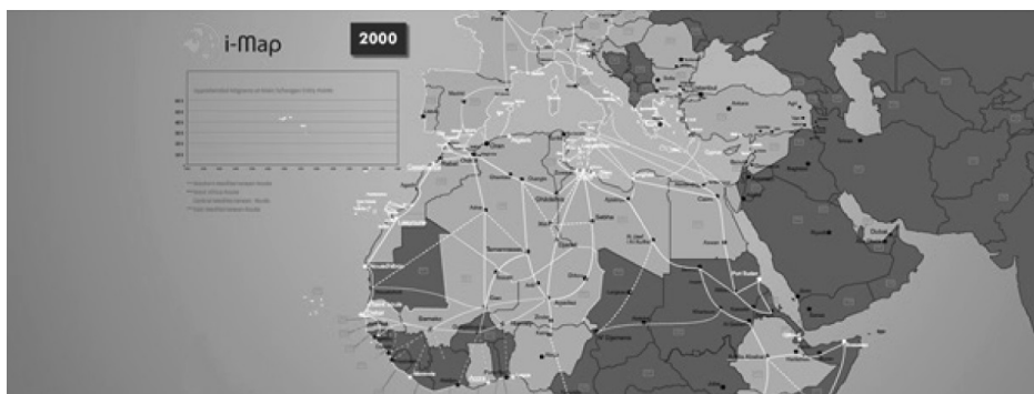
Fig. 1. L'évolution de la migration en Méditerranée après le printemps arabe – 2000

Étude sur la base propre: http://www.lefigaro.fr/international/2015/06/24/01003-20150624ARTFIG00224-cinq-ans-de-flux-migratoires-racontes-en-une-carte.php , [les accès 11.10.2016]