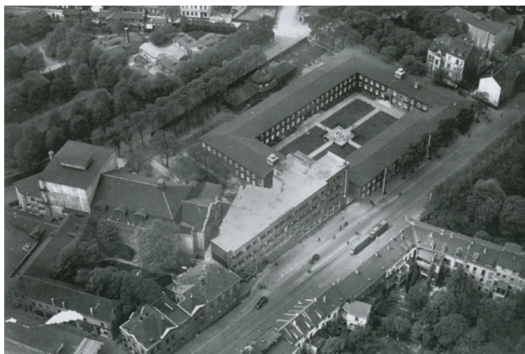
Il. 3. Biblioteka Miejska w Essen (1930)

pożyczenia w 1928 r. osiągnęły stan 390 216 tomów, z czego 75% przypadło na literaturę piękną 16 . Biblioteka nie nadążała jednakowoż za rosnącymi potrzebami i oczekiwaniami czytelników. Mnożyły się skargi na ciasnotę, długie kolejki w wypożyczalni, zakłócenia funkcjonowania czytelni oraz niedostateczny, skąpy księgozbiór, a także na zbyt wysokie opłaty za korzystanie z Biblioteki. Odpowiedzią miasta, jego władz, było rozpoczęcie budowy nowego gmachu przy Hindenburgstr. 25–27 w 1928 r. Dwa lata później, latem 1930 r., została oddana do użytku nowoczesna biblioteka centralna, będąca wzorem dla powstających po niej niemieckich bibliotek oświatowych. Biblioteka centralna mieściła w sobie 4 główne jednostki organizacyjne: 1) bibliotekę oświatową: wypożyczalnię i czytelnię; 2) bibliotekę naukową: wypożyczalnię i czytelnię (biblioteka podręczna ok. 3700 tomów plus dział katalogowy); 3) bibliotekę młodzieżową: wypożyczalnię i czytelnię; 4) bibliotekę muzyczną (2 tys. tomów; 11 tys. muzykaliów) – zob. Il. 3.