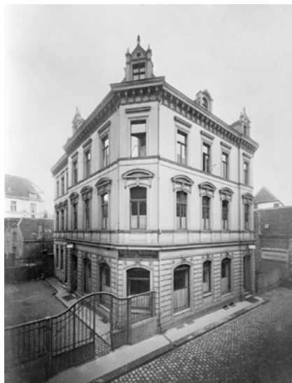
Il. 2. Biblioteka Miejska w Essen (1902)