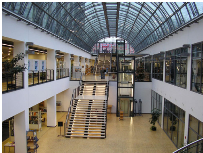
Il. 7. Biblioteka Miejska w Essen, wewnątrz Biblioteki (2006)