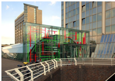
Il. 1. Biblioteka Miejska w Essen (2014)