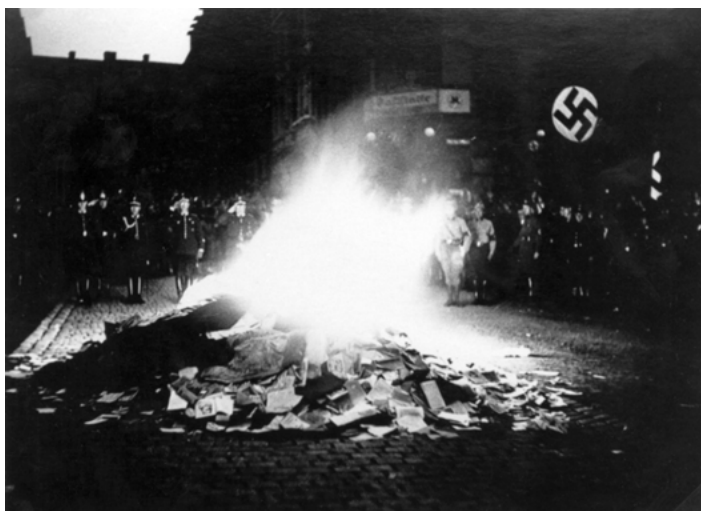
Il. 4. Palenie książek należących do Biblioteki Miejskiej w Essen (1933)

żydowsko-marksistowskiej. Nieznaczną, ale reprezentacyjną część, m.in. dzieła Mannów, Remarque’a, Tucholskiego spalono 21 marca 1933 r., na Gerlingplatz 20 – zob. Il. 4.