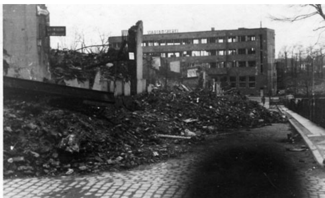
Il. 5. Zniszczona Biblioteka Miejska w Essen (1945)

Wybuch II wojny światowej oznaczał zasadnicze zmiany w funkcjonowaniu BM Essen, tj. podporządkowanie jej działalności „wojennym trybom”. W latach 1940–1941 przeprowadzono w niej zbiórki książek na rzecz tworzonych biblioteczek żołnierskich. Organizowano propagandowe wystawy wspierające ducha wojennego w społeczeństwie. Wojenne rygory, m.in. nakaz zaciemniania okien, spowodowały skrócenie czasu otwarcia Biblioteki do godz. 16.30. W wojennych latach paradoksalnie nastąpił rozwój sieci bibliotecznej (filie) oraz modernizacja już istniejącej. Urządzono m.in. nową wypożyczalnię oraz otwarto nową bibliotekę muzyczną 23 . Na polecenie centralnych władz BM Essen miała działać bez większych zakłóceń. Jedynie niewielka część (10 tys.) najbardziej wartościowych książek została przeniesiona do kazamatów koblenckiej twierdzy, bowiem obawiano się (i słusznie) ich zniszczenia wskutek alianckich bombardowań lotniczych. Tak też się zresztą stało. Największe straty przyniosły Biblioteczne bombardowania w dniach 5/6 i 12 marca 1943 r. Kolejny nalot, 26/27 marca 1943 r., spowodował całkowite spalenie budynku głównego. W wyniku działań wojennych zniszczeniu uległo łącznie 200 tys. tomów 24 – zob. Il. 5.