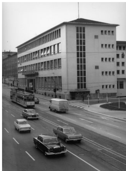
Il. 6. Biblioteka Miejska w Essen (1956)