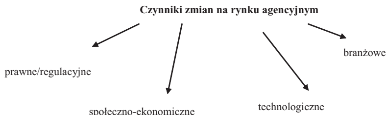
Rys. 1. Czynniki zmian na rynku agencyjnym

Kanał agencyjny ulega i będzie ulegał różnego rodzaju zmianom. Czynniki, które wpływają na ten kanał dystrybucji możemy podzielić na makroekonomiczne, o charakterze prawnym (regulacyjnym), społeczno-ekonomicznym, technologicznym oraz branżowe (rys. 1).