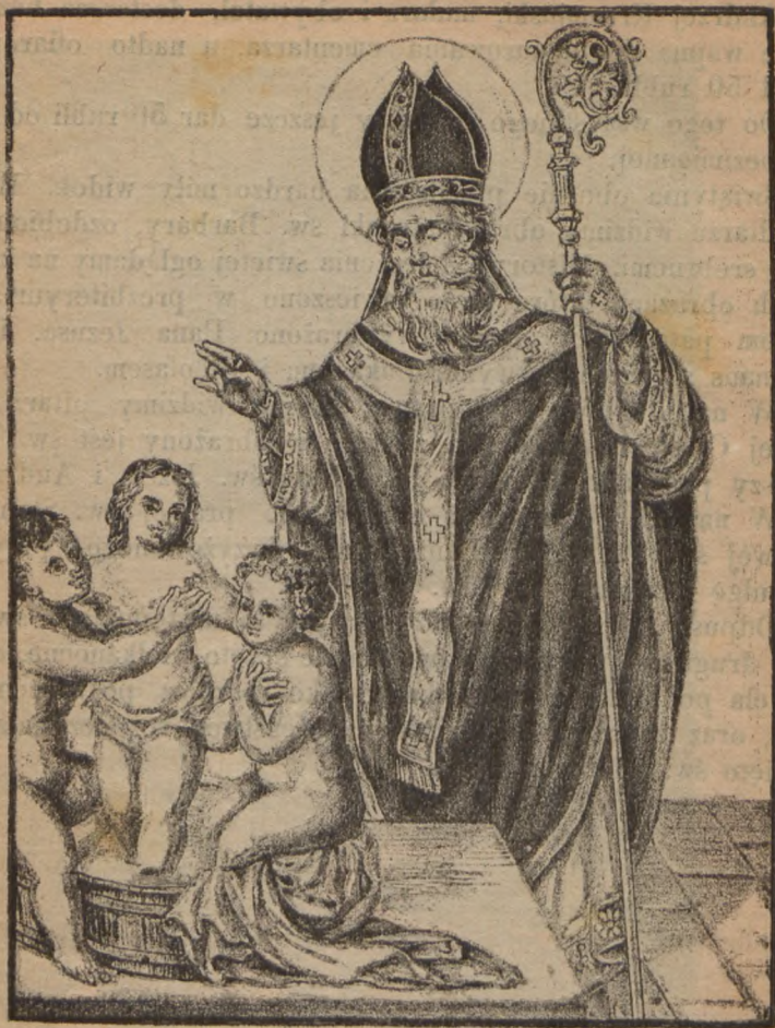
Św. Mikołaj biskup.