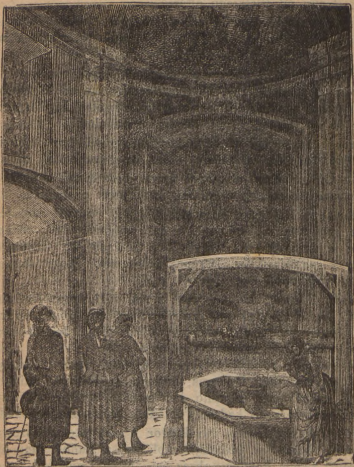
Kapliczka ze studnią w kościele św. Barbary.