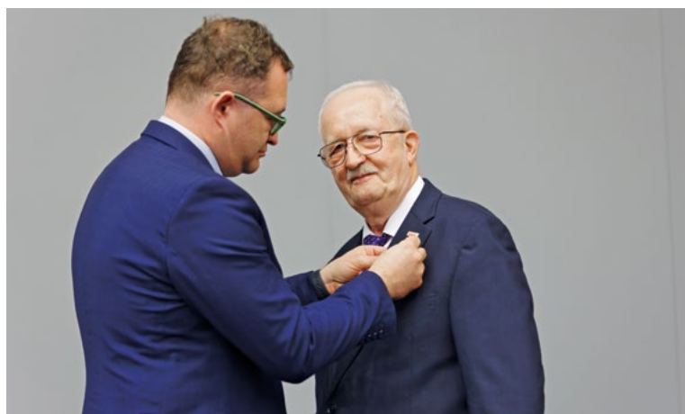
Uroczystość wręczenia odznaczeń państwowych i resortowych, 30 listopada 2022 r.