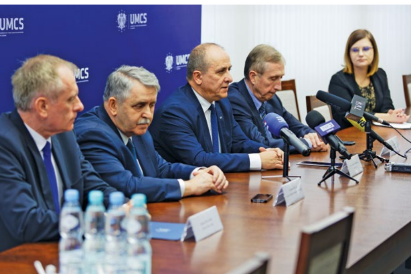
Fot. Bartosz Proń