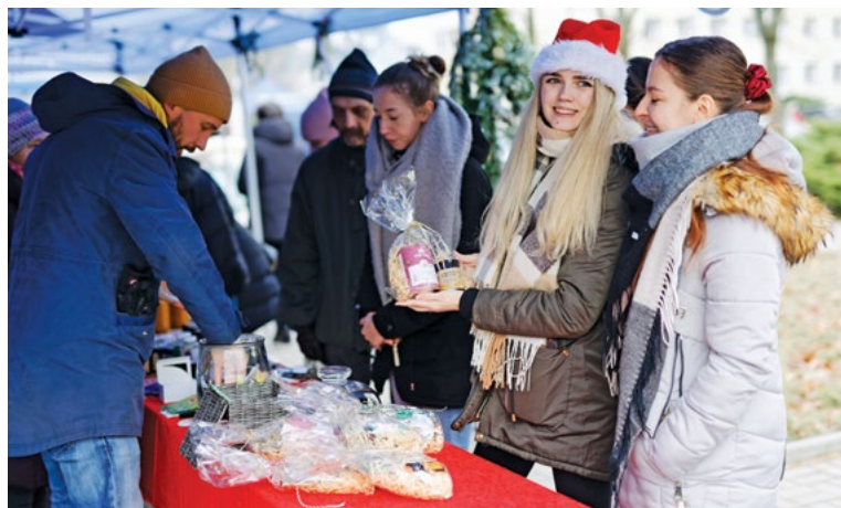
Akademicki Jarmark Świąteczny, 6 grudnia 2022 r.