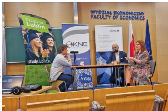
Archiwum Koła Naukowego Ekonomistów