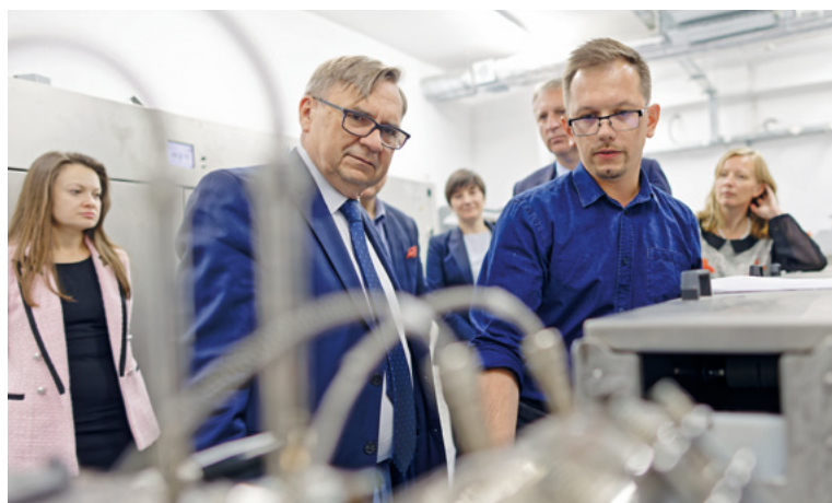
Wizyta delegacji z Uniwersytetu Palackiego, 7-9.07.2022 r.