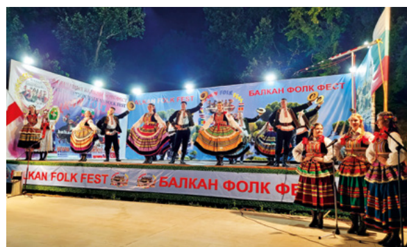
Archiwum ZTL UMCS

Podczas Balkan Folk Fest 2022 nasz zespół wystąpił wielokrotnie na scenach amfiteatru nad Morzem Czarnym w Złotych Piaskach oraz w Centrum Festiwalowo-Kongresowym w Warnie. Artyści ZTL UMCS zapre-