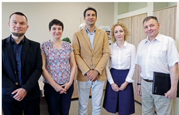
Fot. Klaudia Olender