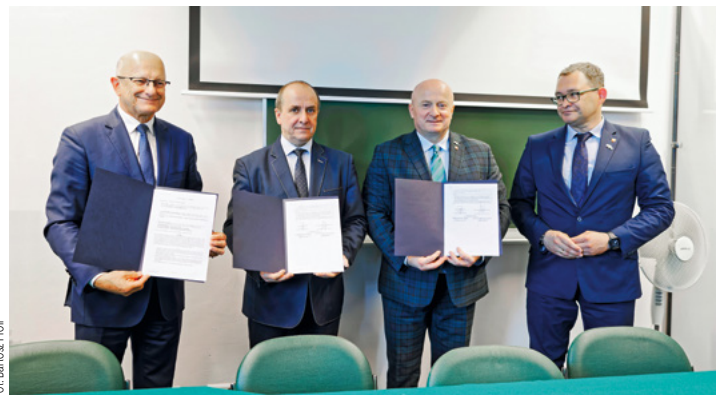
Fot. Barisze Proff

Profesor podał również konkretne przykłady działań: Jeśli ktoś zwróci się do nas z prośbą o zaopiniowa-