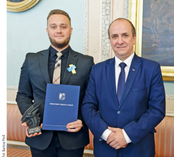
Fot. Bartosz Prohl