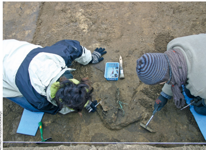
Archiwum Andrzeja Kokowskiego