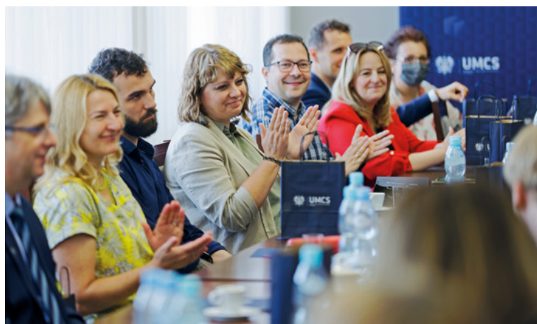
Spotkanie Zespołu ds. pomocy Ukrainie, 15.07.2022 r.