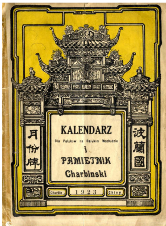
Fot. 1. 1923.

Badając zasoby poszczególnych bibliotek, można zauważyć, że istnieją edycje „Pamiętnika Harbińskiego” różniące się, aczkolwiek nieznacznie, treścią i formą wydawniczą. Przykładowo w zbiorach Biblioteki Uniwersyteckiej im. Jerzego Giedroycia w Białymstoku (online w Podlaskiej Bibliotece Cyfrowej) 36 znajduje się egzemplarz „Pamiętnika” z 1923 roku, posiadający kartę tytułową z wyobrażeniem chińskiej pagody i napisem „Kalendarz dla Polaków na Dalekim Wschodzie i Pamiętnik Charbiński” (fot. 1).