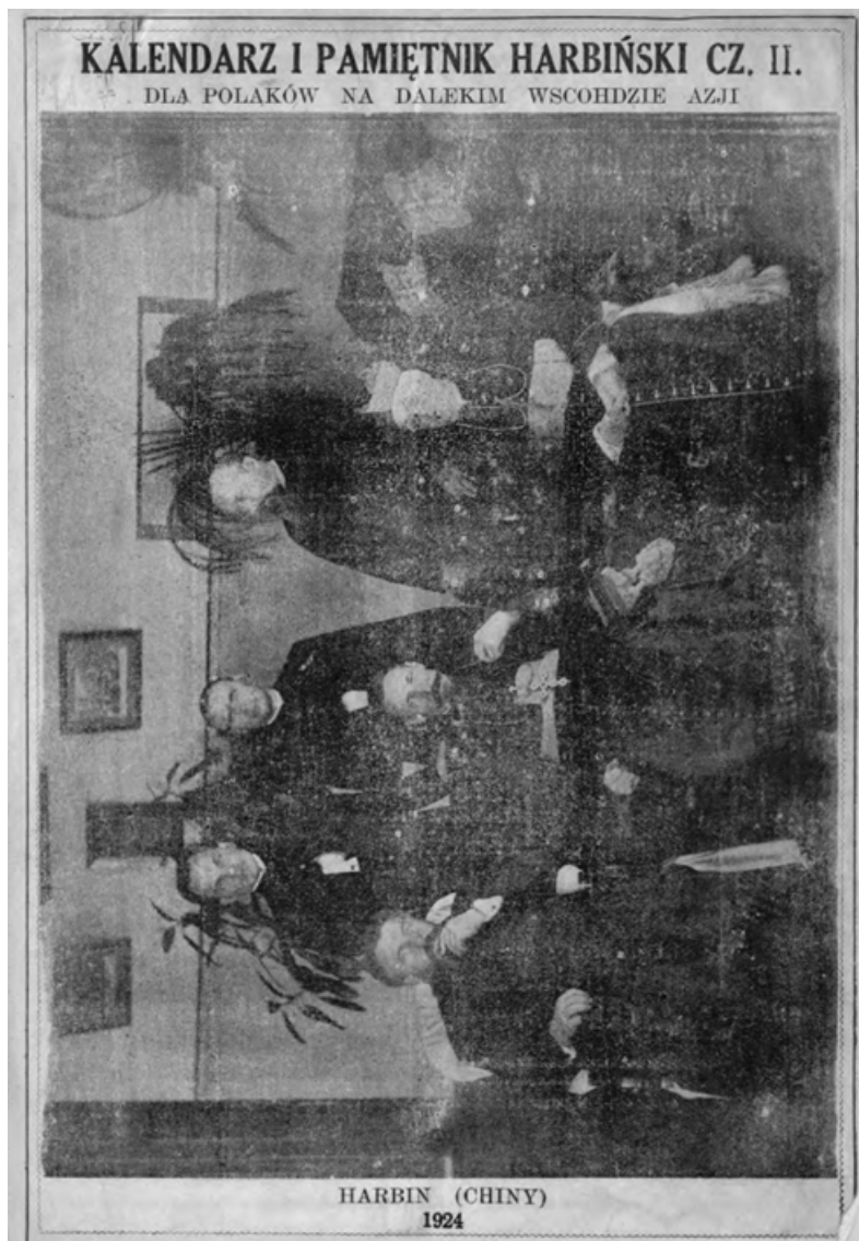
Fot. 3.

Żaden spis czasopism harbińskich, jak również bardzo wyczerpująca bibliografia Adama Winiarza nie wymieniają pozycji „Kalendarz dla Polaków na Dalekim Wschodzie”, „Kalendarz dla Polaków na Dalekim Wschodzie i Pamiętnik Charbiński” czy „Kalendarz i Pamiętnik Harbiński dla Polaków na Dalekim Wschodzie Azji”, stąd nie sposób obecnie stwierdzić, skąd wynikały różnice w poszczególnych wydaniach.