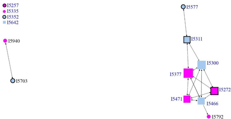
Figura 1. Red de las iniciativas