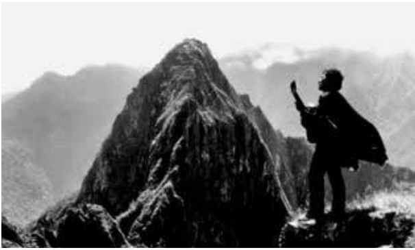
Víctor Jara en Macchu Picchu, 1973