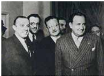
Allende con Haya de la Torre, ca. 1946

El presidente Allende pasó, por cierto, sus años infantiles en la ciudad peruana de Tacna, entonces bajo ocupación chilena como resultado de la Guerra del Pacífico. Su padre desempeñaba allí un cargo administrativo,