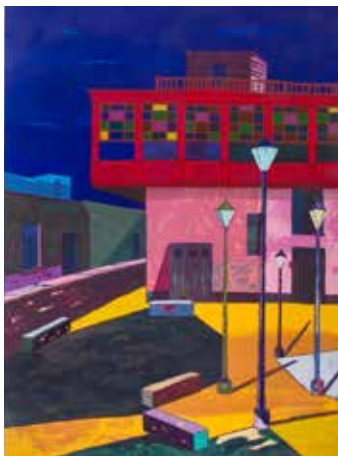
Sin título. Grabado. Lima, 2005