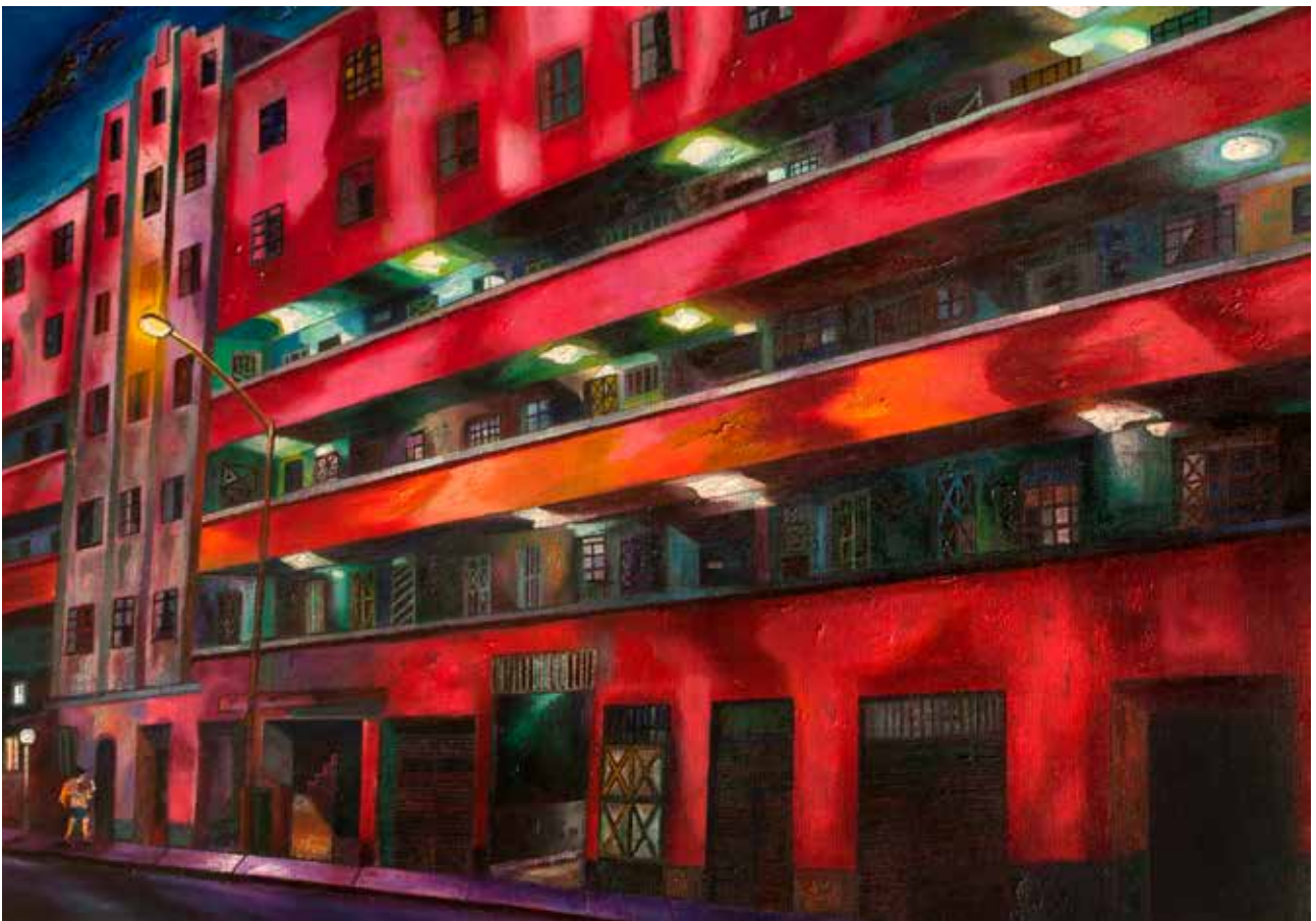
Serie Camina el autor. Lima, 2017