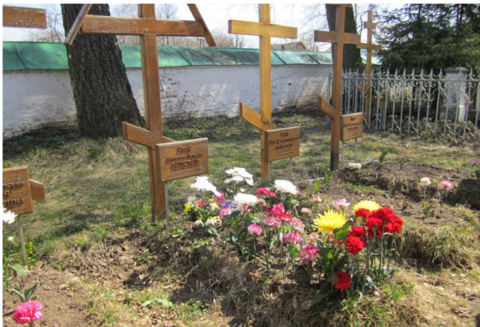
Fot. 3: Mogiła Nikity Iljicza Tolstoj na cmentarzu przy cerkwi w Koczakach.