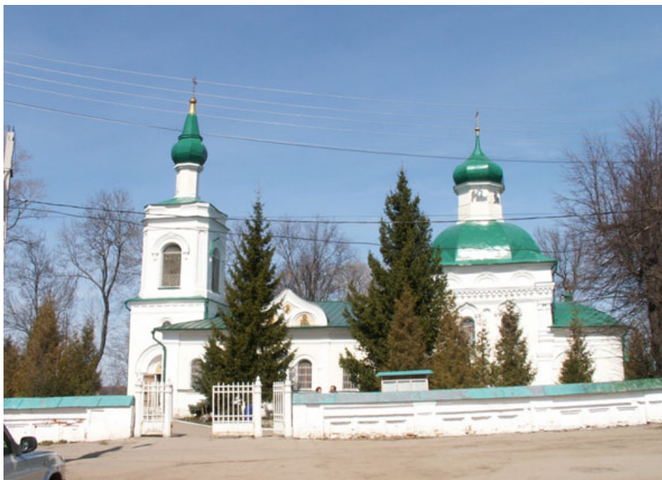
Fot.4: Cerkiew w Koczakach.