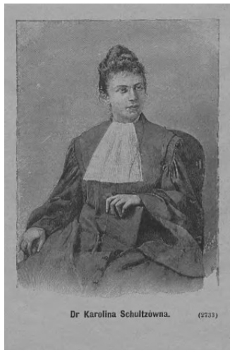
Portret Karoliny Szulcówny, „Tygodnik Ilustrowany” 1889, nr 314, s. 12.

Sukces Szulcówny był szeroko komentowany w prasie. Jak donosił „Kurier Warszawski”, „300 przeszło dzienników najróżniejszych narodowości rozniosło po świecie imię panny Karoliny Szulcówny z okazji tejsze doktoryzacji” ( Ze świata , 1889, s. 4). Na terenie Polski o sprawie pisały przede wszystkim pisma warszawskie, m.in. „Gazeta Polska” (1888, s. 3), „Kurier Codzienny” (K*, 1888, s. 2–4; Warszawianka w Uniwersytecie Paryskim , 1888, s. 4), „Przegląd Tygodniowy” (W.W., 1888/89, s. 5–6), „Tygodnik Ilustrowany” ( Dr Karolina Schultzówna , 1889, s. 12–13), „Kłosa” (Starża, 1889, s. 11–12 i 14), przywoływany już „Kurier Warszawski” ( Ze świata , 1889, s. 4), „Tygodnik Mód i Powieści” (A. Krz., 1889, s. 81–82), a nawet satyryczne „Kolce” ( Plotki i nie plotki , 1889, s. 18; Eszet , 1889, s. 51). Jedną ze swoich kronik w „Kurierze Codziennym” poświęcił Szulcównie Bolesław Prus (Prus, 1888, s. 1–2).