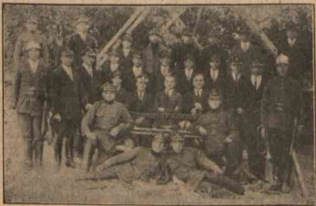
Ochotnicza Straż Pożarna w Chocieńczycech.

Z GM. CHOCIEŃCZYCE, POWIAT WILĘŻYSKI. W celu upamiętnienia 10-iej rocznicy Wskrzeszenia Niepodległości Państwa Polskiego, Rada Gminna