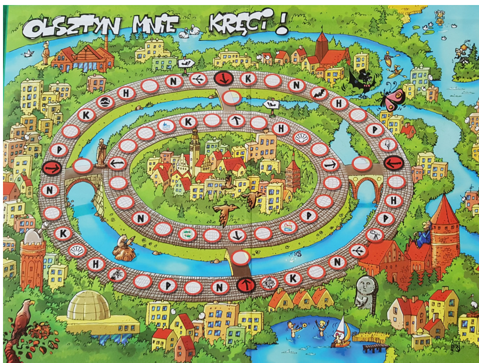
Fot. 2. Gra Olsztyn mnie kręci

została wydana w 100 egzemplarzach i była dystrybuowana głównie w olsztyńskich szkołach podstawowych i gimnazjalnych oraz w wybranych bibliotekach miejskich. Biuro Promocji i Turystyki Olsztyna prezentowało grę na krajowych targach turystycznych. Spotkała się także z dużym zainteresowaniem mieszkańców miasta, gdy uczyniono z niej nagrodę w konkursach organizowanych przez Miejską Informację Turystyczną.