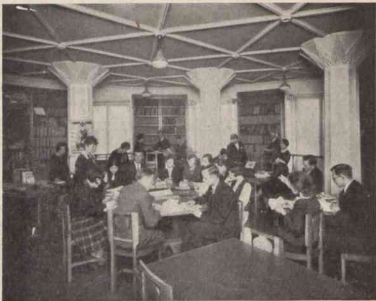
Kurs bibliotekarski T. U. R. Warszawa — kwiecień 1929.

Towarzystwo Uniwersytetu Robotniczego (T. U. R.), założone w styczniu 1923 roku, posiada 211 Oddziałów i około 10 tysięcy członków, 119 kół młodzieży — 4100 członków. Obejmują one swą działalnością cały teren Rzeczypospolitej Polskiej.