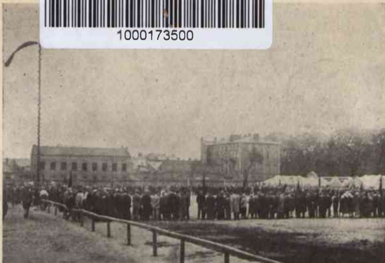
Zlot Młodzieży Robotn. T. U. R. W obozie: Warszawa — czerwiec 1927.

i psychologii młodzieży. Specjalnie Organizacja Młodzieży zajmuje się sportem, tworzeniem drużyn harcerskich, urządzeniem obozów letnich, zlotów młodzieży oraz sprawami, obchodzącymi specjalnie młodzież. Statystyka pracy oświatowej i kulturalnej młodzieży dołączona została do wyżej wymienionych cyfr, ilustrujących działalność Towarzystwa. Do tego w tem miejscu dodajemy cyfry, dotyczące prac, prowadzonych wyłącznie przez młodzież. Kół sportowych Organizacji Młodzieży istniało 46; bierze w nich udział 609 członków; meczów i treningów zorganizowano 726. Obozów letnich urządzono 6; liczba uczestników 275. Zlotów odbyło się 3, przy udziale 2.500 osób. Gromad harcerskich Organizacja posiada 30.