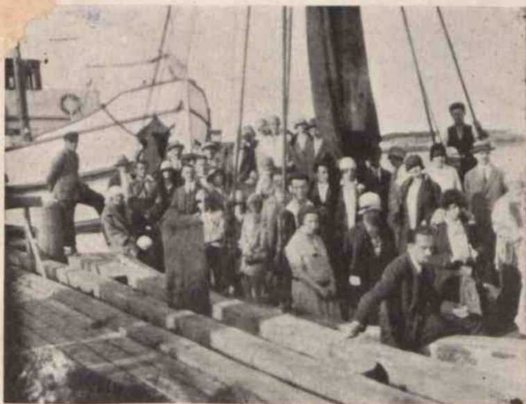
Wycieczka T. U. R. nad morze. Na kutrze rybackim: Orłowo — Gdynia — lipiec 1926.

istniało 93. Za czynnik rozbudzający potrzebę wiedzy Towarzystwo uważa odczyty luźne, jak również cykle odczytowe. Odczytów takich odbyło się 4230, wysłuchało ich 327.660 słuchaczy; cykli odczytowych zorganizowano 83. Przy Zarządzie Głównym istnieje centrala prelegentów, wysyłanych przez Sekretariat Generalny Towarzystwa na zapotrzebowania oddziałów; wyjazdów takich odbyło się za czas istnienia Towarzystwa 437, odczytów wygłoszonych przez prelegentów centrali wysłuchało 82.980 osób. Z drugiej strony, licząc się z brakiem u robotników elementarnego przygotowania, Towarzystwo organizuje kursy dla analfabetów i kursy dokształcające w zakresie szkoły powszechnej, ale tylko w tych miejscowościach, gdzie brak takich kursów, prowadzonych przez samorząd; kursów tego rodzaju zorganizowano 127. Kursów praktycznych, zaspakajających potrzeby zawodowe czy życiowe robotników i robotnic odbyło się 33. W miarę potrzeby Zarząd Główny i poszczególne okręgi i organizacje młodzieży urządzają kursy scentralizowane, poświęcone jednemu zagadnieniu; na czas kursu słuchacze przerywają swoje zajęcia zawodowe i prowadzą wspólne życie internatowe. Kursów takich, zwanych „szkołami robotniczymi“ odbyło się 17 (między innymi dla działaczy samorządowych, pracowników związków zawodowych, pracowników teatrów robotniczych, kurs dla Białorusinów, dwa kursy bibliotekarskie i t. d.).