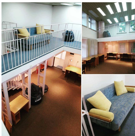
Fot. 3. Strefa relaksu i nauki w Bibliotece Głównej UMCS.