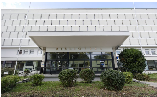
Fot. 1. Budynek Biblioteki Głównej UMCS.

Główną siedzibą Biblioteki od roku 1968 jest gmach przy w ul. Radziszewskiego 11, usytuowany w samym centrum kampusu, w bliskim sąsiedztwie budynków