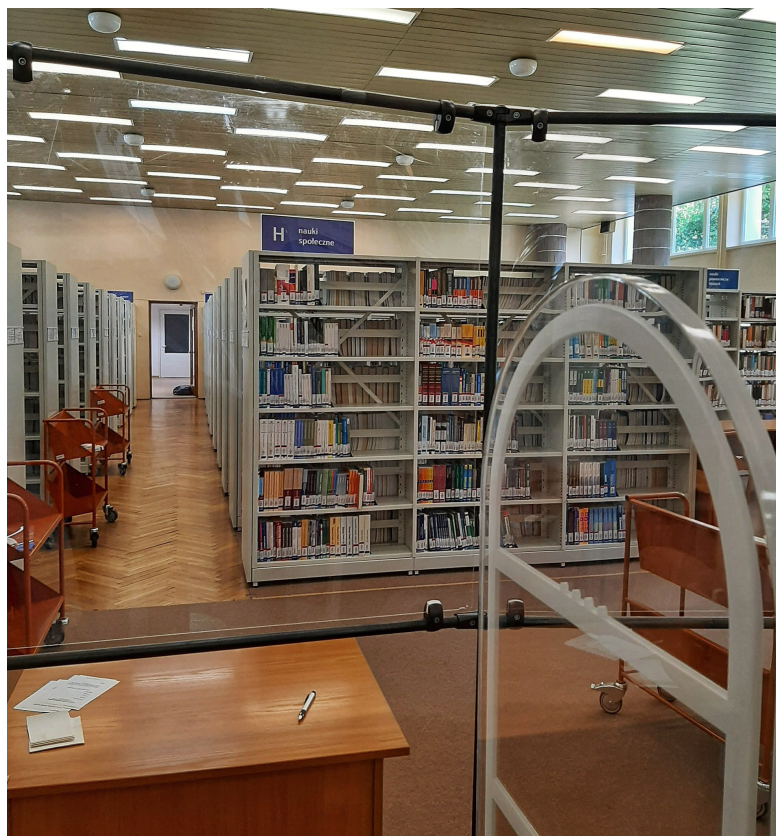
Fot. 2. Czytelnia 1 Wolnego Dostępu na parterze budynku Biblioteki UMCS.