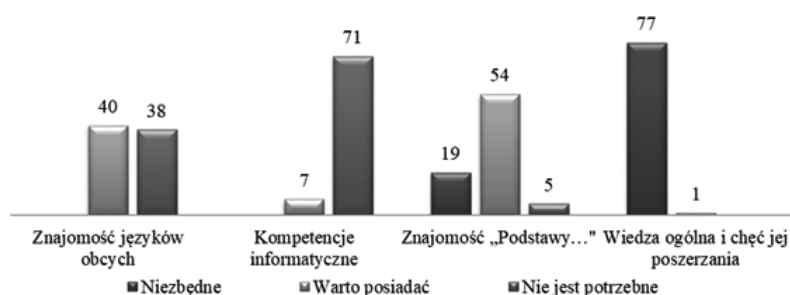
Rysunek 2. Ocena przez badanych rodziców przydatności wybranych kompetencji i wiedzy w przypadku decyzji o edukacji domowej

Jedynym obszarem, który badani rodzice niemal jednogłośnie uznali za niezbędny, jest wiedza ogólna. W tym przypadku tylko jedna osoba wyraźnie stwierdziła, że warto ją posiadać. Szczegółowe dane zamieszczono na rysunku 2.