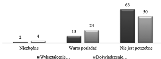
Rysunek 1. Ocena przez badanych rodziców przydatności wykształcenia i doświadczenia pedagogicznego w przypadku decyzji o edukacji domowej

Zdecydowana większość badanych rodziców (aż 63 osoby) uznała, że wykształcenie pedagogiczne nie jest potrzebne do tego, by uczyć dziecko w domu. Zaledwie 13 respondentów przyznało, że warto je posiadać, a 2 ankietowanych stwierdziło, że jest ono niezbędne. Nieco inaczej zostało ocenione doświadczenie w nauczaniu. W tym przypadku 50 rodziców wskazało, że jest ono niepotrzebne, 24 respondentów przyznało, że warto je posiadać, a za niezbędne uznało je 4 badanych. Jedna osoba nie odpowiedziała na te pytania. Szczegółowe dane zamieszczono na rysunku 1.