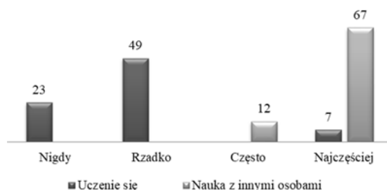
Rysunek 3. Wskazania badanych rodziców dotyczące samodzielnego lub pod opieką dorosłych uczenia się ich dzieci

Za interesujące autorki badania uznały poznanie sposobu organizacji edukacji domowej przez badanych rodziców. Respondenci mieli możliwość zaznaczenia w pytaniach dotyczących organizacji procesu nauczania realizowanego w domu adekwatną do stosowanej częstotliwość: najczęściej, często, rzadko, nigdy. Rozpoczęto od pytań dotyczących tego, z kim dziecko się uczy. W niektórych wypowiedziach na forach dla rodziców podkreślana jest zmiana od uczenia przez innych do uczenia się samodzielnego przez dziecko (www4). Samodzielne uczenie się dzieci zostało wskazane jako najczęściej realizowane przez 7 rodziców, aż 49 ankietowanych napisało, że rzadko tak jest, a 23 respondentów stwierdziło, że nigdy. Potwierdzają to wyniki uzyskane w kolejnym pytaniu, w odpowiedzi na które rodzice jako najczęściej stosowaną zaznaczyli naukę pod opieką dorosłych (67 wskazań). Szczegółowe dane zamieszczono na rysunku 3.