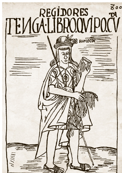
Guaman Poma, 1615

De las obras de Polo, fuera de las que no deseó aparecer como autor, sabemos por sus propias menciones. Entre las primeras, destaca el Tratado sobre la Religión , al que Polo alude en distintos pasajes. Conocemos una pequeña parte de dicho texto publicada como De los errores y supersticiones de los indios, sacados del Tratado y Averiguación que hizo el licenciado Polo , por el III Concilio Limense en 1585. El Tratado de la Religión incluye capítulos sobre las momias y sobre la historia de cada uno de los incas que gobernaron, puesto que los incas fueron objeto de adoración y, por tanto, también un tema de religión. Y lo sabemos por las alusiones del propio Polo a lo largo de muchos pasajes contenidos en esta edición. Otra impor-