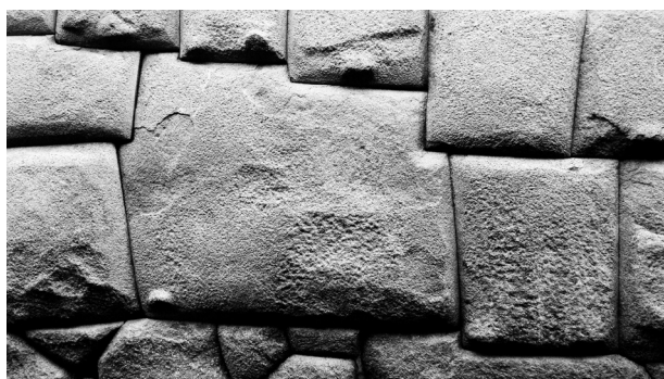
Piedra de los doce ángulos, Cuzco

En la introducción de su obra, Polo nos explica con toda claridad que su propósito es describir cuáles eran los bienes que se contribuían para el Inca y cómo se distribuían los trabajos necesarios para dichas contribuciones. Todo ello, contribuciones y distribuciones, se enmarca en un verdadero aparato legal (fueros) que están registrados en quipus. La forma de repartir o distribuir los trabajos considera Polo que es la mejor y más provechosa manera de asegurar el buen funcionamiento de la economía colonial, más específicamente de organizar el trabajo en las minas. Polo declara haber dedicado mucho tiempo al estudio de estas formas de organización y haber hallado -según su experiencia como autoridad (corre-