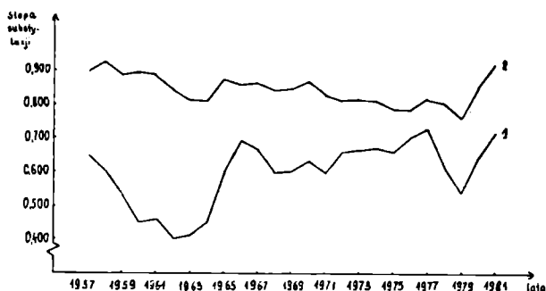
Ryc. 2. Ilustracja wskaźnika stopy substytucji owsa jęczmieniem w cenach państwowych (1) i cenach wolnorynkowych (2) w latach 1957—1981

Z przedstawionych na rycinie stóp substytucji wynika, że w analizo-