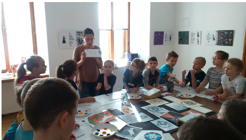
Dzieci na warsztwach plastycznych przeprowadzonych w oparciu o książkę obrazkową Agnieszki Zawadzkiej Ballada o piecu kaflowym . W tle ekspozycja kart rozkładowych książki.