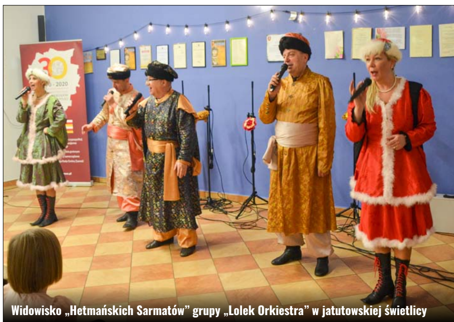
Widowisko „Hetmańskich Sarmatów” grupy „Lolek Orkiestra” w jatutowskiej świetlicy