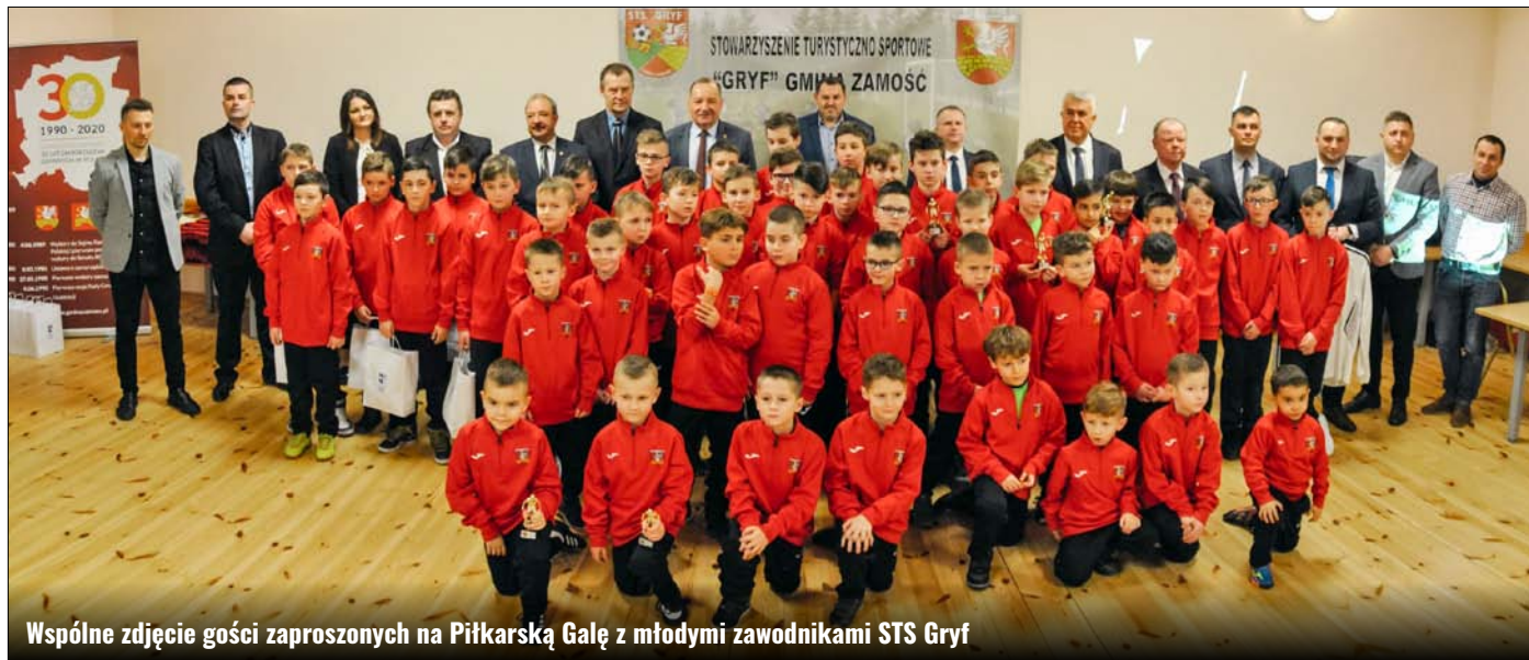
Wspólne zdjęcie gości zaproszonych na Piłkarską Galę z młodymi zawodnikami STS Gryf

Żaki, Orliki, Młodziki, Trampkarze - ponad setka trenujących piłkarzy - od małego do większego, dwunastu nagrodzonych „najlepszych zawodników”, podziękowania dla piętnastu sponsorów, znakomici goście, wiele słów uznania dla Zarządu klubu i trenerów - to tylko niektóre akcenty Piłkarskiej Gali STS „Gryf” Gmina Zamość, która odbyła się przy pełnej sali w piątkowy wieczór, 21.02.2020 r., w świetlicy w Zawadzie.