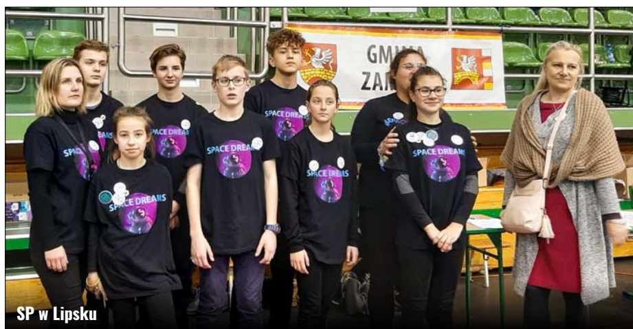
SP w Lipsku