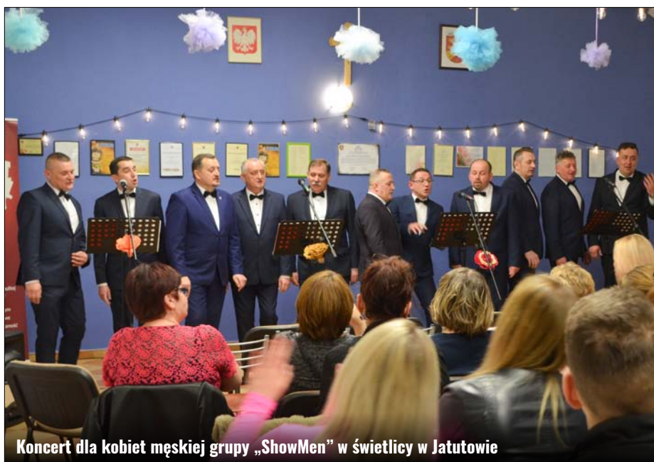
Koncert dla kobiet męskiej grupy „ShowMen” w świetlicy w Jatutowie