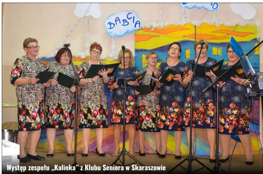
Występ zespołu „Kalinka” z Klubu Seniora w Skaraszowie