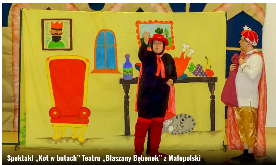
Spektakl „Kot w butach” Teatru „Błaszany Bębenek” z Małopolski

Podczas tegorocznych ferii zimowych Gminny Ośrodek Kultury Gminy Zamość oferował w murach swojej siedziby w Wysokiem szeroki wachlarz zajęć i atrakcji, zwłaszcza dla najmłodszych. W przeciągu 2 styczniowych tygodni 2020 roku można było skorzystać z zajęć plastycznych, ruchowych, kulinarnych czy edukacyjnych. W GOK-u pojawili się również specjaliści goście, m.in. Mikołaj, aktorzy Teatru „Błaszany Bębenek” oraz młodzi specjaliści od robotyki.