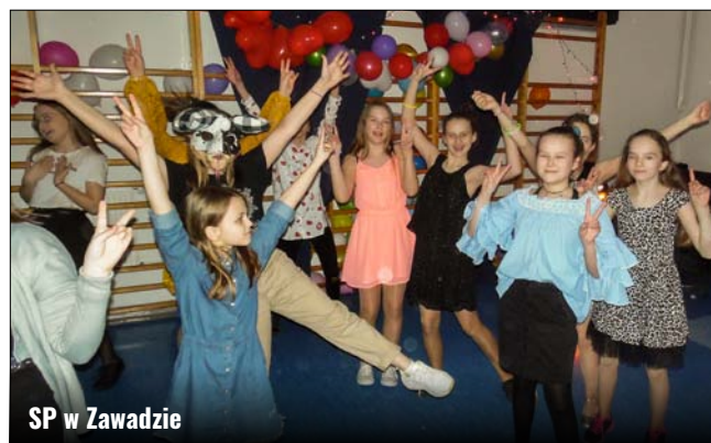
SP w Zawadzie

W dniu 14 lutego 2020 roku w Szkole Podstawowej im. Marii Konopnickiej w Zawadzie obchodziliśmy Dzień Świętego Walentego,