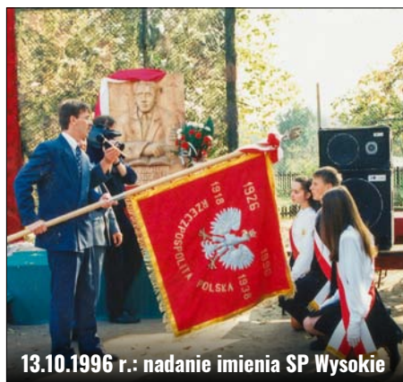
13.10.1996 r.: nadanie imienia SP Wysokie