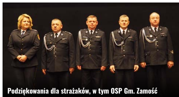
Podziękowania dla strażaków, w tym OSP Gm. Zamość