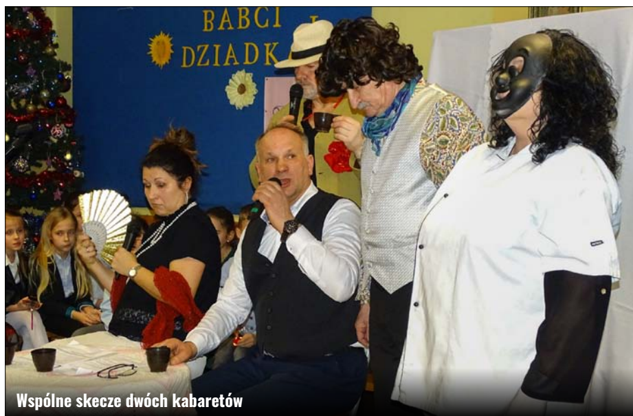
Wspólne skecze dwóch kabaretów