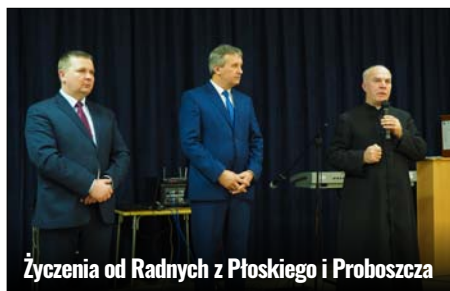
Życzenia od Radnych z Płoskiego i Proboszcza

Większą część występów jasełkowych przygotowała Szkoła Podstawowa im. Papieża Jana Pawła II w Płoskiem, dlatego do miejscowej świetlicy przybyło sporo przedszkolaków i uczniów oraz ich