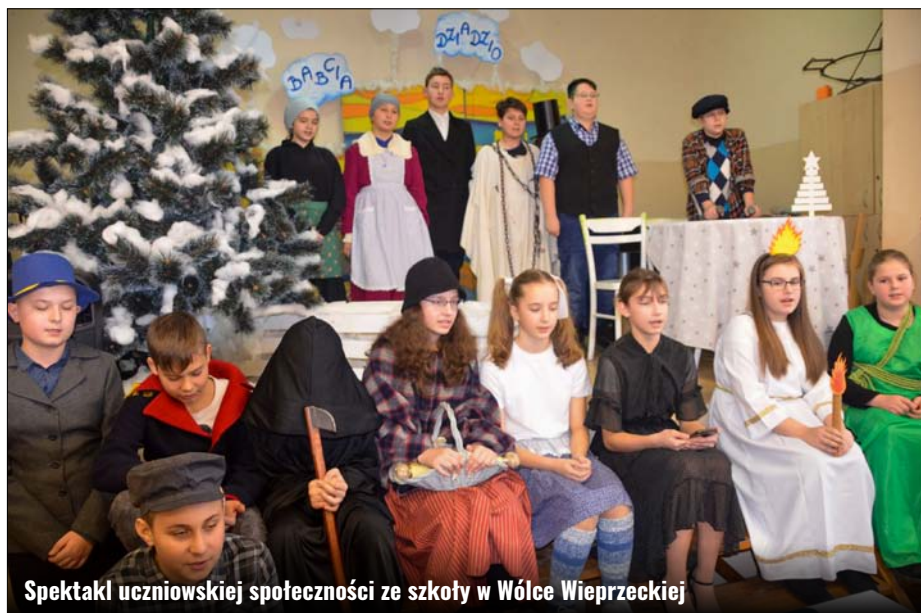
Spektakl uczniowskiej społeczności ze szkoły w Wólce Wieprzeckiej

Dnia 01.02.2020r. w Świetlicy Wiejskiej w Skaraszowie odbyła się po raz dwudziesty wyjątkowa uroczystość z okazji Dnia Babci i Dziadka. Inicjatorami święta byli: Samorząd Gminy Zamość, sołectwo Skaraszów, Koło Gospodyń Wiejskich w Skaraszowie a także nauczyciele Szkoły Podstawowej im. Batalionów Chłopskich w Wólce Wieprzeckiej. Frekwencja, jak co roku, dopisała.