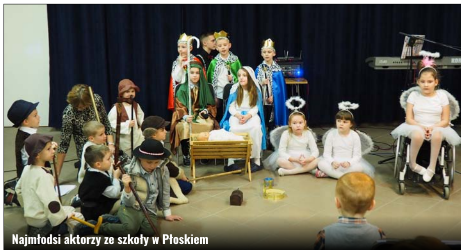
Najmłodszy aktorzy ze szkoły w Płoskiem

Noworoczno-jasełkowe spotkanie mieszkańców Płoskiego obfitowało w tym roku w artystyczne występy z udziałem dzieci i młodzieży szkolnej oraz miejscowego zespołu wokально-choralnego „Ale Cantare”. W sobotnie popołudnie dnia 1 lutego 2020 roku świetlica wypełniła się wielopokoleniową widownią. Część artystyczna składała się nie tylko ze spektaklu jasełkowego, ale też dziecięcych występów taneczno-ruchowych, kolęd w wykonaniu szkolnego chóru oraz mini-koncertu młodzieżowego zespołu muzyczno-wokalnego. „Ale Cantare” zaśpiewało na finał.