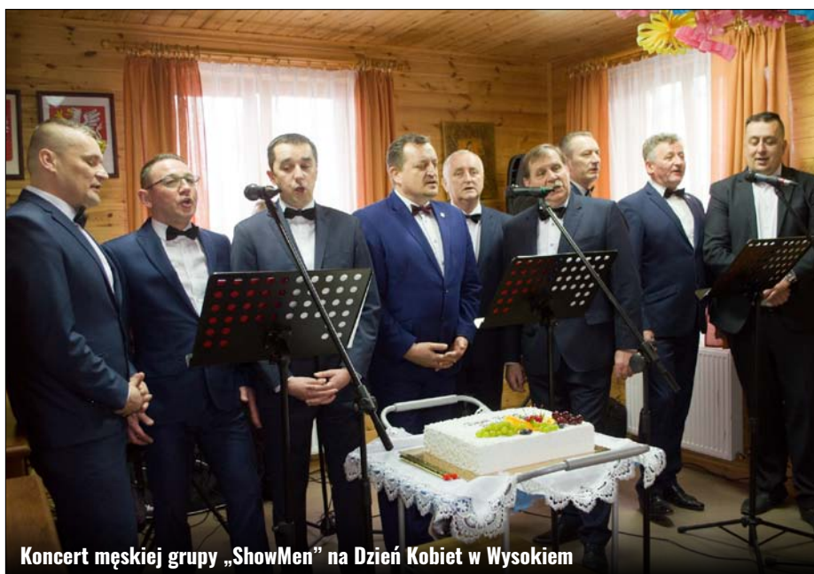
Koncert męskiej grupy „ShowMen” na Dzień Kobiet w Wysokiem

Organizatorami spotkania byli: Samorząd Gminy Zamość, w tym Sołtys z Radą Sołecką Płoskiego, Stowarzyszenie Kobiet na rzecz promocji i rozwoju środowisk lokalnych 28+, przy wsparciu organizacyjnym Koła Gospodyń Wiejskich w Płoskiem oraz Gminnego Ośrodka Kultury Gminy Zamość. GOK: KC