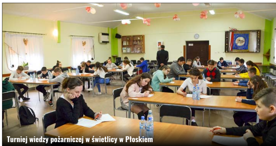
Turniej wiedzy pożarniczej w świetlicy w Płoskiem