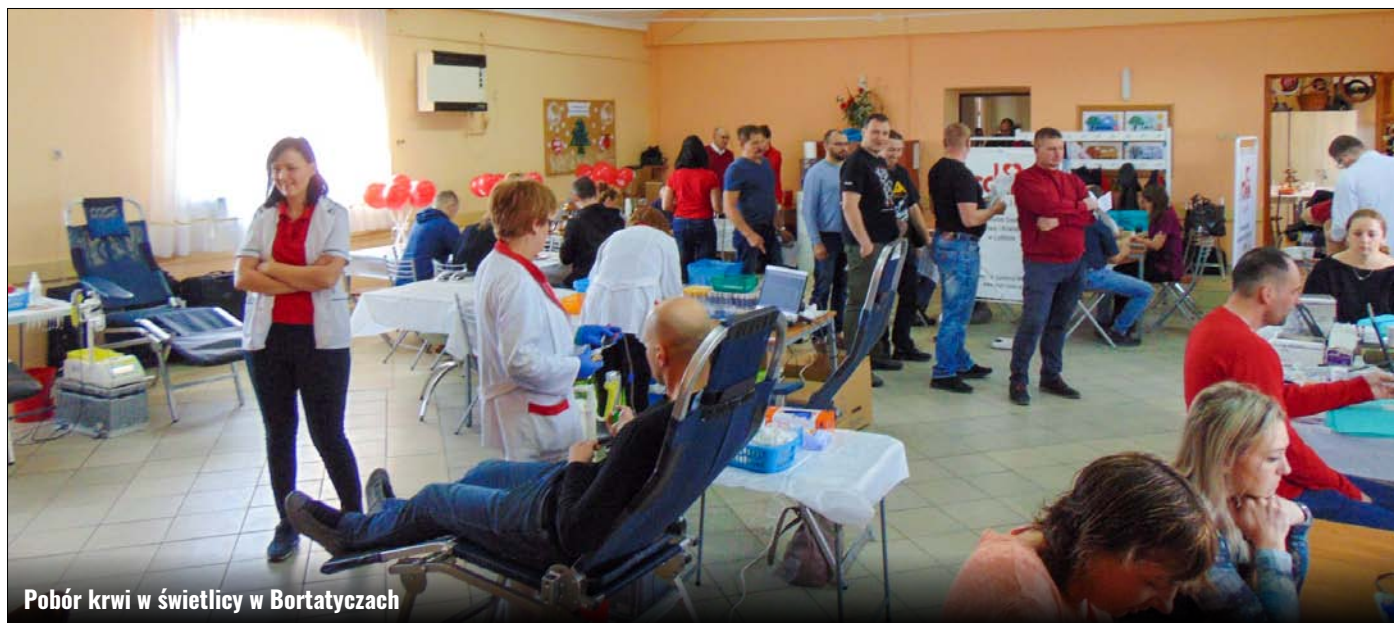
Pobór krwi w świetlicy w Bortatyczach

Zaczęliśmy kolejny rok krwiodawczy i pierwsza tegoroczna gminna akcja poboru krwi za nami. Akcja odbyła się 16 lutego 2020 r. w świetlicy w Bortatyczach. Piękna akcja z jeszcze piękniejszym hasłem „Podziel się miłością” i 105 wspólnych osób, które podzieliło się swoją krwią z innymi. Przełożyło się to na 47,25 litrów pobranej krwi. Z całego serca dziękujemy dawcom, którzy tego dnia podzielili się sobą.