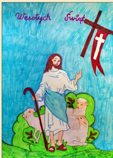
Praca Aleksandry Bielak