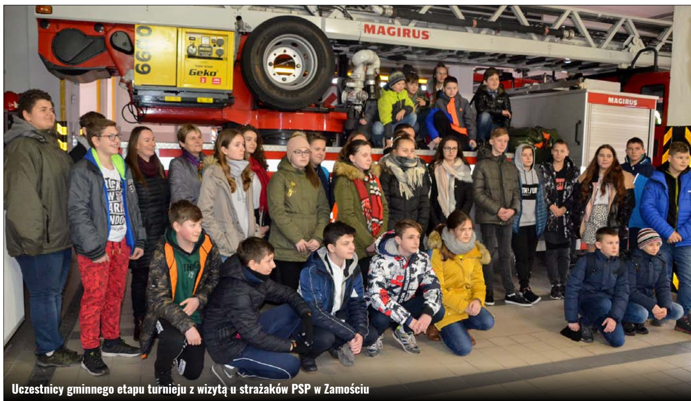
Uczestnicy gminnego etapu turnieju z wizytą u strażaków PSP w Zamościu

W dniu 11 lutego 2020 r. upłynął termin przeprowadzenia eliminacji szkolnych do Ogólnopolskiego Turnieju Wiedzy Pożarniczej pn. „Młodzież Zapobiega Pożarom”. Głównym celem niniejszego konkursu jest zapoznanie dzieci i młodzieży z problematyką ochrony przeciwpożarowej i zasadami bezpieczeństwa pożarowego.