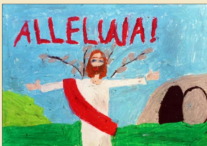
Praca Natalii Stręciwilk