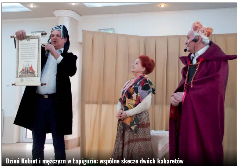
Dzień Kobiet i mężczyzn w Łapiguzie: wspólne skecze dwóch kabaretów