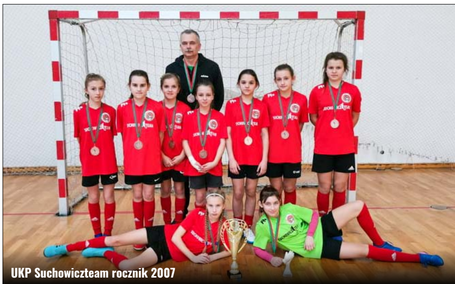
UKP Suchowiczteam rocznik 2007

9 drużyn wzięło udział w Halowych Mistrzostwach Województwa Lubelskiego „Mała Piłkarska Kadra CzeKa”/rocznik