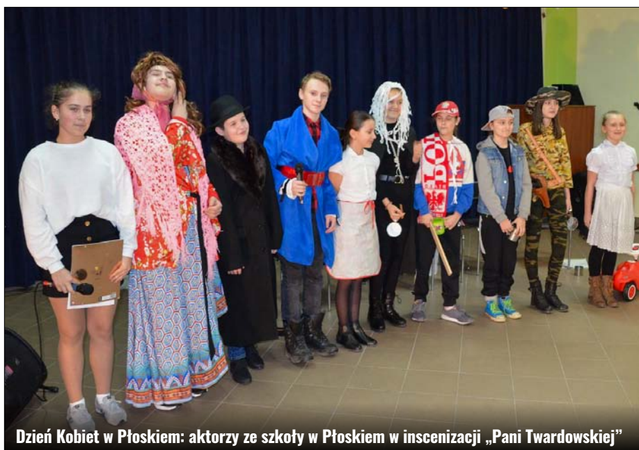
Dzień Kobiet w Płoskiem: aktorzy ze szkoły w Płoskiem w inscenizacji „Pani Twardowskiej”