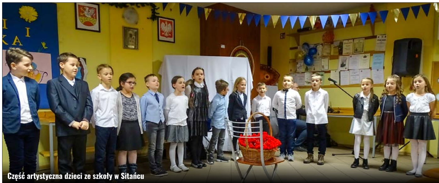
Część artystyczna dzieci ze szkoły w Sitańcu