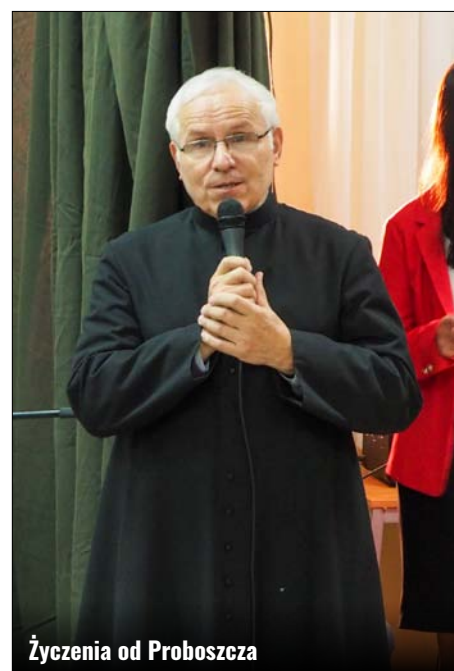
Życzenia od Proboszcza

przełamali się na znak pokoju. Ostatni akcent spotkania należał do Koła Gospodyń Wiejskich w Bortatyczach, które specjalnie na ten wieczór zapełniło stoły świątecznymi przekąskami. Swoją znaczący wkład w organizację tego wydarzenia miało również Stowarzyszenie Kobiet na rzecz promocji i rozwoju środowisk lokalnych 28+, skupiające członkinie wszystkich Kół Gospodyń Wiejskich z terenu Gminy Zamość. GOK: KS i JK