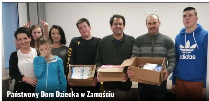
Państwowy Dom Dziecka w Zamościu

Honorowi Dawcy we krwi mają pomoc i dzielenie się z potrzebującymi. Ich otwartość i gotowość reagowania na ludzką krzywdę to wzorowy przykład dla innych. Dlatego powstał pomysł na zorganizowanie zbiórki pod hasłem „PODAJ DALEJ”. W myśl tej inicjatywy honorowi dawcy mogą podzielić się otrzymanymi po oddaniu krwi czekoladami, które z kolei trafią będą do ośrodków opiekuńczych. W dniu 23 lutego 2020 r. przedstawiciele Klubu Honorowych Daw-