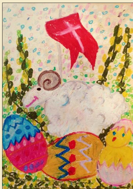
Praca Bartłomieja Kobla