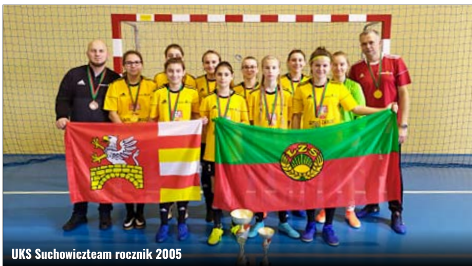
UKS Suchowiczteam rocznik 2005