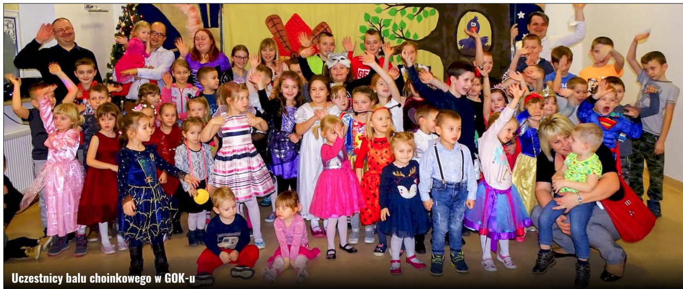
Uczestnicy balu choinkowego w GOK-u