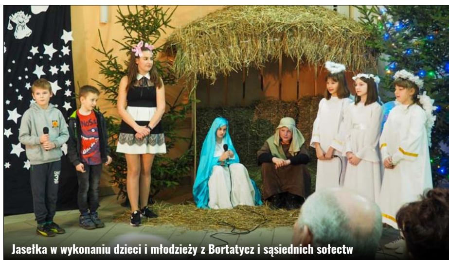
Jasełka w wykonaniu dzieci i młodzieży z Bortatycz i sąsiednich sołectw