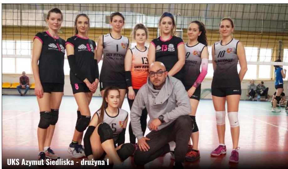
UKS Azymut Siedliska - drużyna I

Podsumowanie rozgrywek Zamojskiej Ligi Siatkówki dla Kobiet sezonu 2019/2020 z udziałem dwu zespołów UKS Azymut