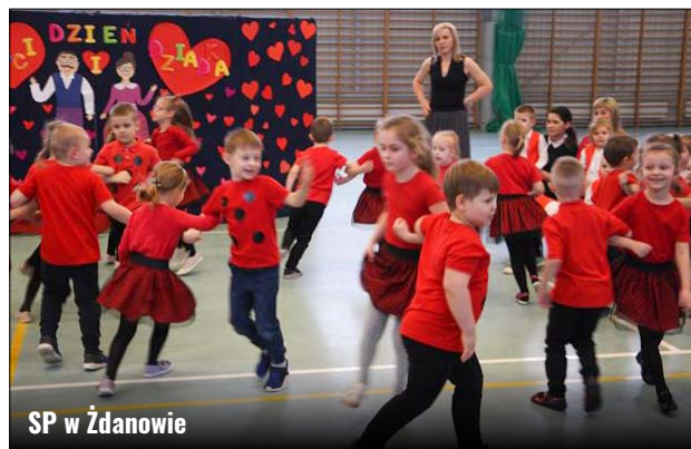
SP w Żdanowie

Dnia 21 lutego dzieci z oddziałów przedszkolnych ze Szkoły Podstawowej w Żdanowie wybrały się do Zamojskiego Domu Kultury i tam obejrzały sceniczną wersję baśni pt., „Jaś i Małgosia”, na której wychowały się