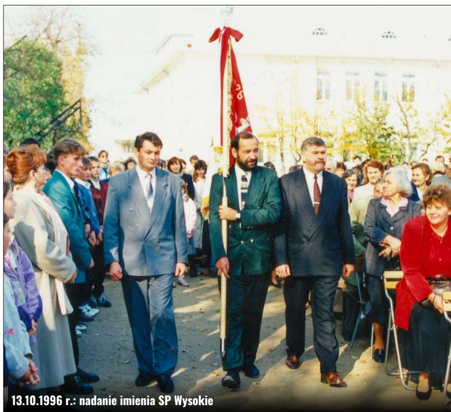
13.10.1996 r.: nadanie imienia SP Wysokie

Ostatnia sesja Rady Gminy Zamość I kadencji miała miejsce w dniu 26 maja 1994 roku. Trzy tygodnie później, 19 czerwca 1994 roku, miały w Polsce miejsce kolejne wybory samorządowe. W Gminie Zamość wybieraliśmy wówczas 24 Radnych. Pierwszą sesję Rady Gminy Zamość II kadencji wyznaczono na 7 lipca 1994 roku.