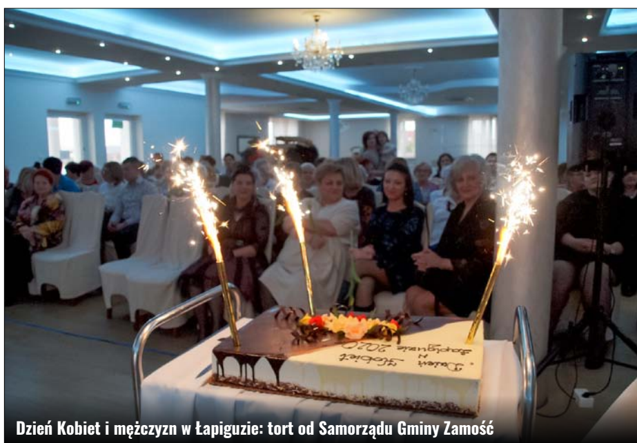
Dzień Kobiet i mężczyzn w Łapiguzie: tort od Samorządu Gminy Zamość