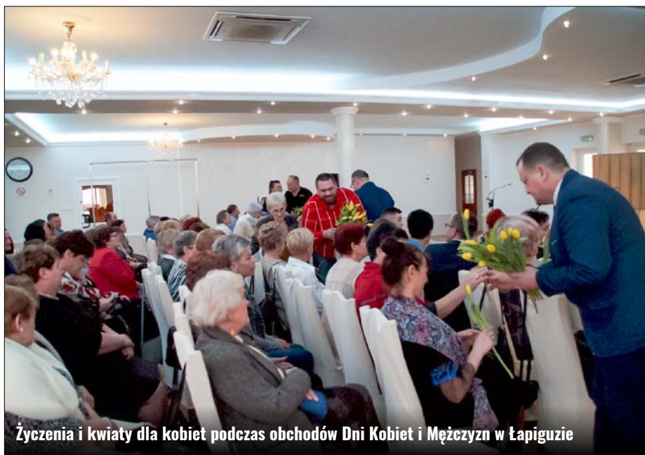
Życzenia i kwiaty dla kobiet podczas obchodów Dni Kobiet i Mężczyzn w Łapiguzie