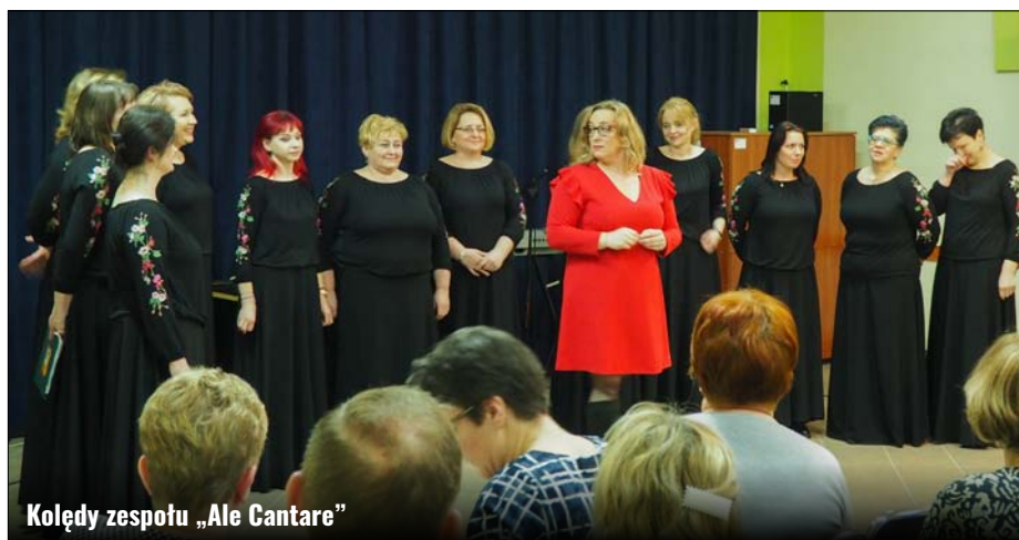
Kolędy zespołu „Ale Cantare”