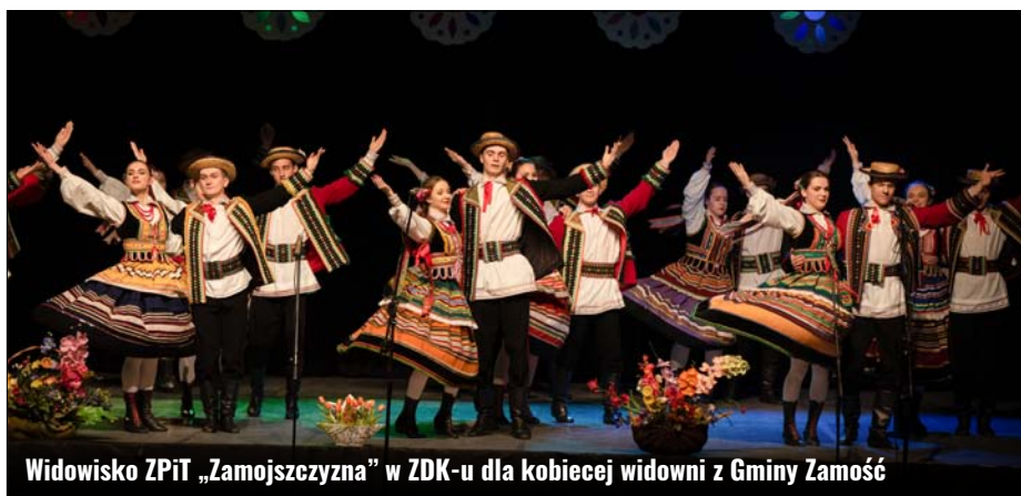
Widowisko ZPiT „Zamojszczyzna” w ZDK-u dla kobiecej widowni z Gminy Zamość