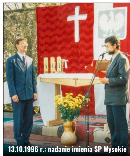
13.10.1996 r.: nadanie imienia SP Wysokie