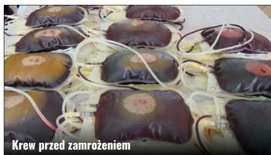
Krew przed zamrożeniem

także: Stowarzyszenie Kobiet na Rzecz Promocji i Rozwoju Środowisk Lokalnych 28+, Młodzieżowa Rada Gminy Zamość, GOK Gminy Zamość, Zarząd Oddziału Gminnego Związku OSP RP w Zamościu z jednostką OSP w Bortatyczach i Sołectwo Bortatycze. Zarząd Klubu HDK przy UG