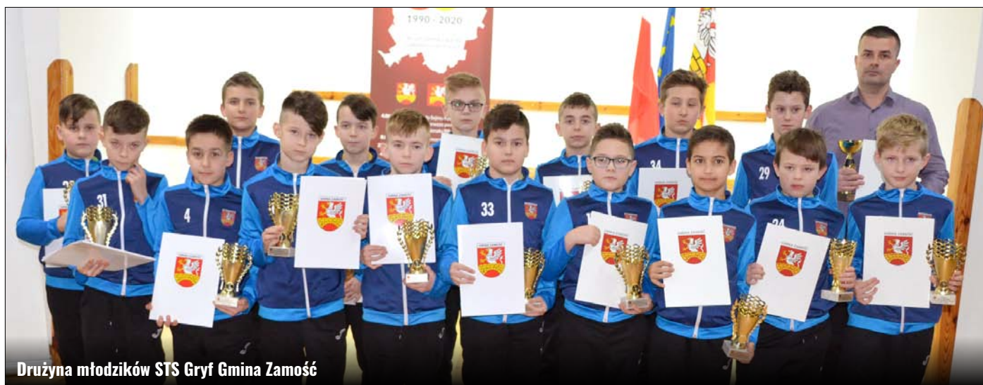
Drużyna młodzików STS Gryf Gmina Zamość

W czwartkowe popołudnie 20 lutego br. w świetlicy wiejskiej w Białowoli odbyła się Gminna Gala Sportu – wręczenie nagród za osiągnięte wyniki sportowe oraz osiągnięcia w działalności sportowej za 2019 rok. Zostały one przyznane na podstawie Uchwały Nr XIV/134/19 Rady Gminy Zamość z dnia 28 listopada 2019 r. w sprawie nagród i wyróżnień przyznawanych przez Gminę Zamość za osiągnięte wyniki sportowe oraz osiągnięcia w działalności sportowej.