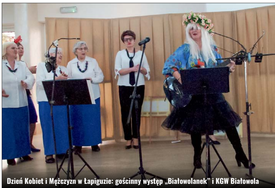
Dzień Kobiet i Mężczyzn w Łapiguzie: gościnny występ „Białowolanek” i KGW Białowola

Spotkanie zorganizowano w ramach zadania „Wspieranie i upowszechnianie idei samorządowej poprzez wdrażanie programu pobudzania aktywności obywatelskiej”. Organizacji podjęli się: Samorząd Gminy Zamość, w tym Sołtys z Radą Sołecką Łapiguzi i Stowarzyszenie Kobiet na rzecz promocji i rozwoju środowisk lokalnych 28+, wspierani przez Koło Gospodyń Wiejskich w Łapiguzie, Kabaret „Taka Potrzeba”, Dom Weselny „Ambrozja” w Łapiguzie i Gminny Ośrodek Kultury Gminy Zamość. GOK