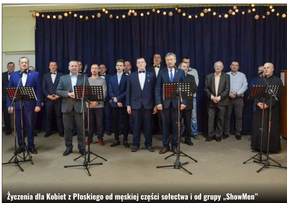
Życzenia dla Kobiet z Płoskiego od męskiej części sołectwa i od grupy „ShowMen”