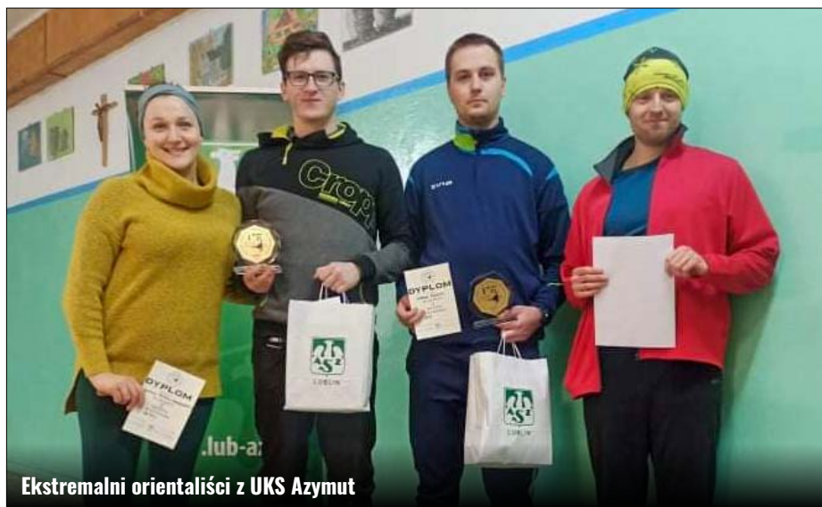
Ekstremalni orientaliści z UKS Azymut

W sobotę 15 lutego 2020 r. w okolicach Goraja na terenie Roztocza Zachodniego odbyła się XIX edycja Ekstremalnej Imprezy na Orientację „Skorpion 2020”. W zawo-