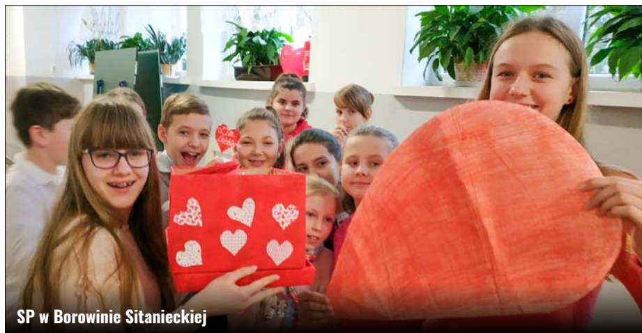
SP w Borowinie Sitanieckiej