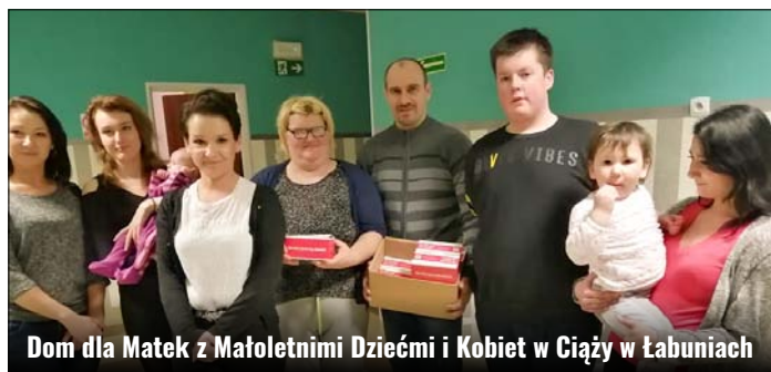
Dom dla Matek z Małoletnimi Dziećmi i Kobiet w Cięży w Łabuniach