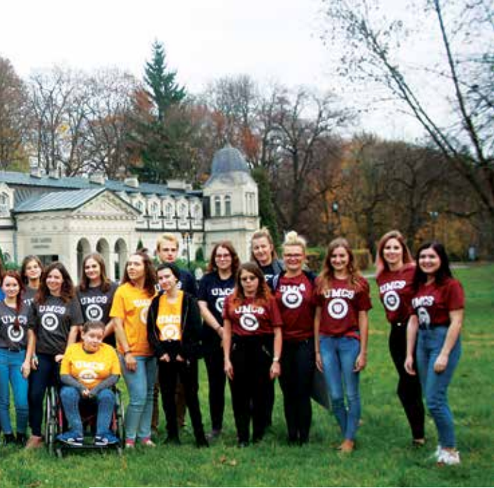
↑ Dni Adaptacyjne organizowane przez Zrzeszenie Studentów Niepełnosprawnych „Alter Idem”

nikom oraz organizatorom wiedzę na temat dobrych praktyk wsparcia osób będących w kryzysie, rozpoczęto realizację Psychokina (projekcja filmów psychologicznych wraz z panelem dyskusyjnym). Projekt po krótkiej przerwie został ponownie wznowiony i jest rozwijany.