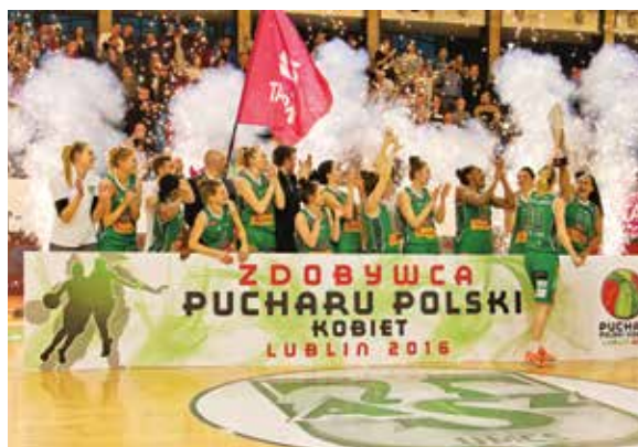
← Pszczółka Polski Cukier AZS UMCS Lublin zdobyła Puchar Polski w 2016 r.