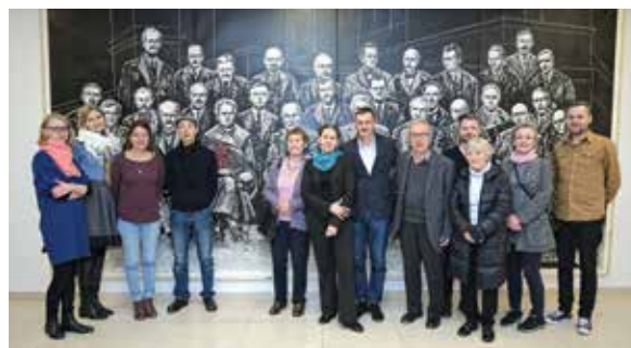
↑ Wizyta wnuków Marii Curie-Skłodowskiej w Lublinie. W tle dwóroryt wykonany z okazji 150. rocznicy urodzin Patronki Uczelni

↑ Koncert z okazji 70-lecia Chóru Akademickiego UMCS