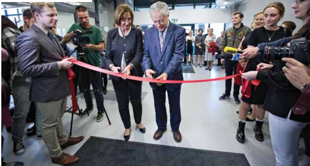
Uroczyste otwarcie stołówki akademickiej „Trójka” →