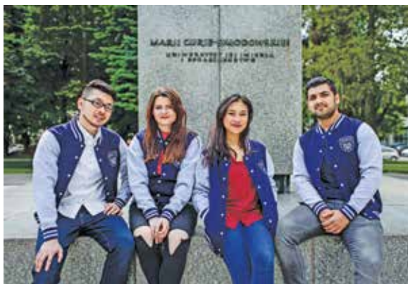
↑ Immatrykulacje studentów (wrzesień 2019)