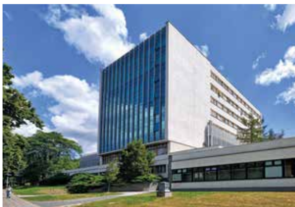
← Rektorat po termomodernizacji i dobudowie klatki schodowej z windą