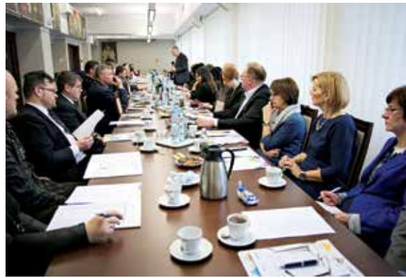
← Spotkanie z dyrektorami Szkół Partnerskich (styczeń 2016 r.)

W wydarzeniu corocznie udział biorą zespoły uczniów ze szkół licealnych i technikum z całego kraju. Nasza uczelnia stała się również pomysłodawcą i inicjatorem konkursu językowego pn. Wielki Test Języka Angielskiego „Challenge Accepted”. Jak dotąd przeprowadzone zostały 3 edycje testu. W każdej z nich wyczerpivano był limit 400 przewidywanych miejsc. Konkurs ma charakter otwarty, dzięki czemu jest to wydarzenie skierowane nie tylko do społeczności uniwersyteckiej, ale również szerokiego grona odbiorców. Obydwa wyżej wymienione konkursy językowe zorganizowane zostały we współpracy z Centrum Nauczania i Certyfikacji Języków Obcych. Na UMCS-ie zainicjowano również cykl wydarzeń organizowanych dzięki wsparciu i współpracy nawiązanej z Santander Universidades . Wśród nich wymienić należy „Meet_up Santander x UMCS”. Ideą spotkań jest zapraszanie postaci popkultury, mediów, nauki, polityki na otwarte spotkania ze środowiskiem akademickim. Do tej pory gośćmi UMCS byli m.in. Beata Tadla, Artur Barciś czy twórcy bloga i autorzy licznych książek podróżniczych „Bussem przez Świat”. Pracownicy uczelni stale uczestniczą w organizacji szeregu mniejszych eventów, takich jak np. Dzień UMCS w Kraśniku, Dzień Dziecka z Uniwersytetem Dziecięcym czy Drzwi Otwarte Wydziału Zamiejscowego w Puławach.