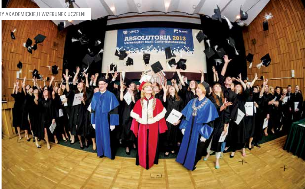
Absolutoria (2013 r.) →