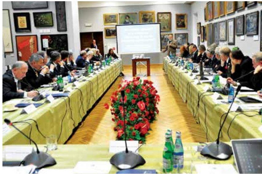
↑ Obrady Konferencji Rektorów Uniwersytetów Polskich na Zamku Lubelskim w 2014 r.