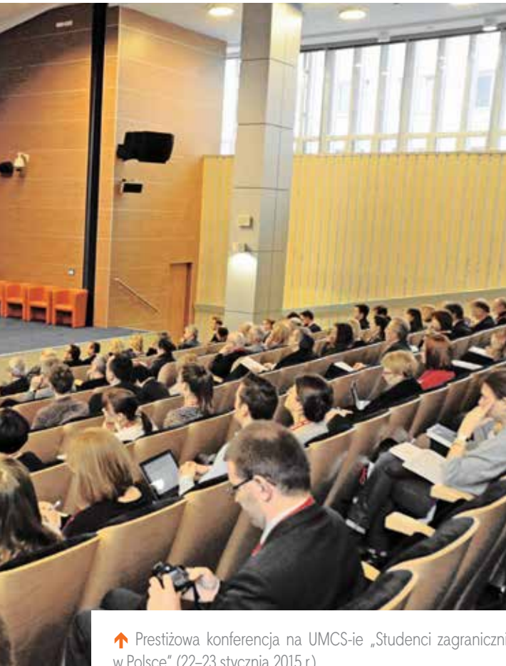
↑ Prestiżowa konferencja na UMCS-ie „Studenci zagraniczni w Polsce” (22–23 stycznia 2015 r.)

Uniwersytet Marii Curie-Skłodowskiej w ramach projektu finansowanego przez Narodową Agencję Wymiany Akademickiej pt. „Foreigners @ UMCS – kompleksowy zespół działań i rozwiązań systemowych zorientowanych na usprawnienie oraz wzmocnienie instytucjonalne UMCS w zakresie obsługi studentów i kadry z zagranicy” rozpoczął także realizację zadania polegającego na opracowaniu i wykonaniu Wayfinding Design , czyli koncepcji systemu kierowania ruchem użytkowników na terenie i w obiektach Uniwersytetu Marii Curie-Skłodowskiej za pomocą informacji wizualnej, z uwzględnieniem potrzeb osób anglojęzycznych.