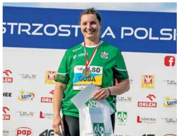
↑ Paulina Guba podczas 94 PZLA MP w Lublinie