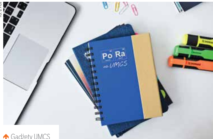
↑ Gadżety UMCS

Na naszej Uczelni ostatnimi laty zorganizowano liczne eventy. Największym cyklicznym wydarzeniem skierowanym do uczniów oraz nauczycieli są Drzwi Otwarte UMCS, które corocznie przyciągają kilka tysięcy uczestników . Kolejnym przedsięwzięciem skierowanym do uczniów jest konkurs językowy „Faces of America”. W 2020 r. przeprowadzona została już jego VI edycja.