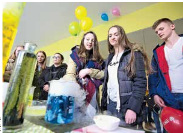
← Koło Naukowe Alkahest

Na przestrzeni ostatnich 8 lat dynamicznie rozwijał się studencki ruch naukowy. W 2012 r. na Uczelni było zarejestrowanych 86 kół naukowych (Wydział Artystyczny – 7, Biologii i Biotechnologii – 5, Chemii – 3, Ekonomiczny 4, Filozofii i Socjologii – 9, Humanistyczny – 29, Matematyki, Fizyki i Informatyki – 4, Nauk o Ziemi i Gospodarki Przestrzennej – 4, Pedagogiki i Psychologii – 8, Politologii – 6, Prawa i Administracji – 7). W czerwcu 2020 r. w UMCS-ie działały łącznie 133 koła naukowe (Wydział Artystyczny – 10, Biologii i Biotechnologii – 7, Chemii – 4, Ekonomiczny