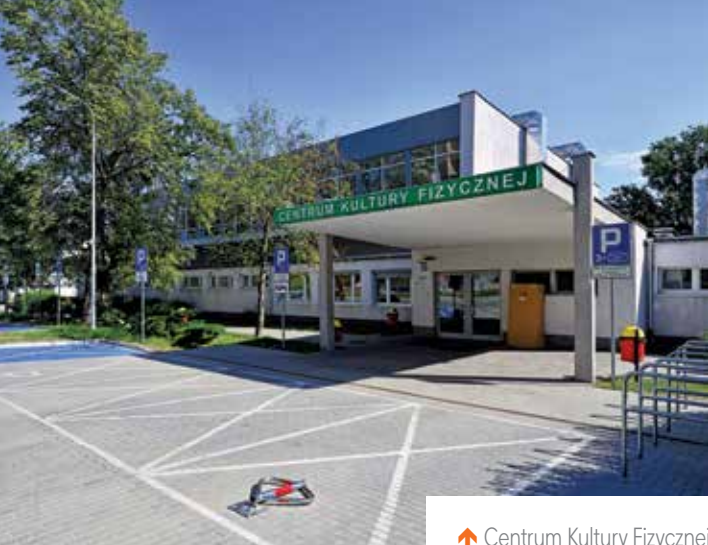
↑ Centrum Kultury Fizycznej