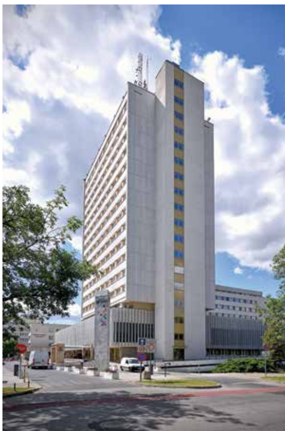
↑ Centrum Analityczno-Programowe dla Zaawansowanych Technologii Przyjaznych Środowisku Ecotech-Complex