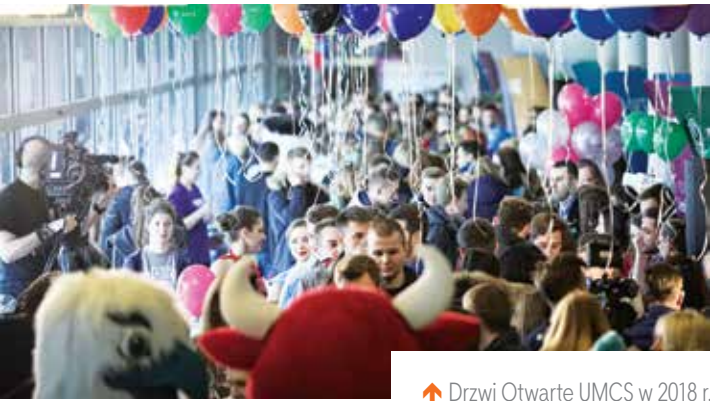
↑ Drzwi Otwarte UMCS w 2018 r.