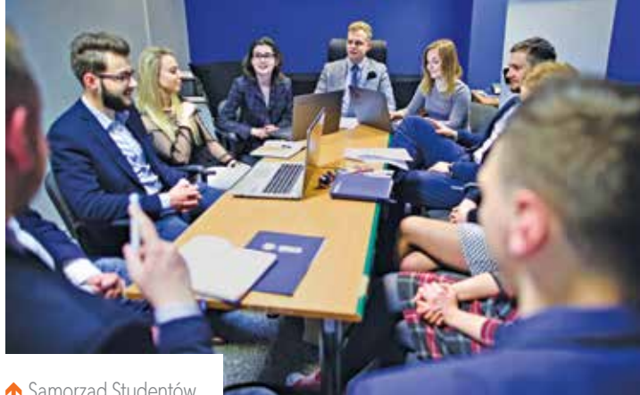
↑ Samorząd Studentów

W ostatnich latach organizacje i koła naukowe działające w strukturach UMCS-u zrealizowały wiele ciekawych i wartościowych projektów o charakterze naukowym, badawczym, artystycznym, kulturalnym oraz społecznym (m.in. uczestniczyły w cyklicznych wydarzeniach takich jak Lubelskie Dni Kultury Studenckiej „Kozienalia”, Noc Biologów, GIS Day, Drzwi Otwarte UMCS, Światowy Dzień Zdrowia, akcjach charytatywnych – Wielka Orkiestra Świątecznej Pomocy, Szlachetna Paczka, Pomóż Dzieciom Przetrwać Zimą).