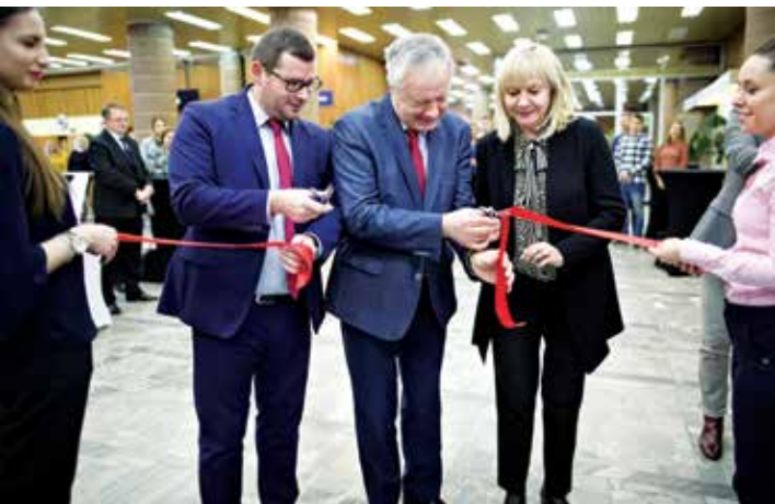
↑ Otwarcie Filii Santander Universidades w Bibliotece Głównej UMCS (26 listopada 2018 r.)