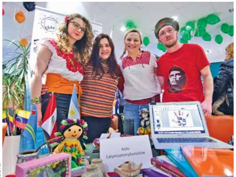
Koło Naukowe Latynoamerykanistów ↓