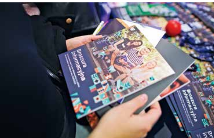
↑ Broszura z ofertą kształcenia dla kandydatów na studia

Stoisko UMCS-u na targach edukacyjnych ↓