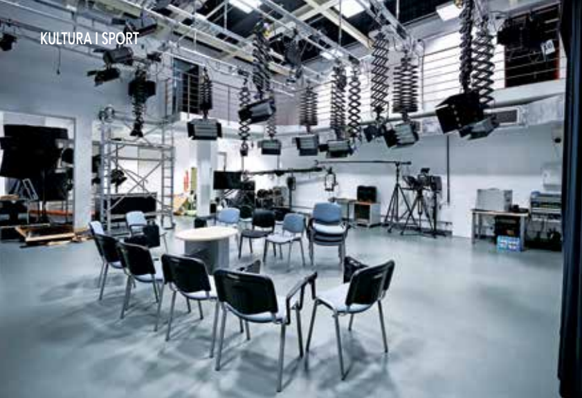
↑ Studio telewizyjne w Inkubatorze Medialno-Artystycznym