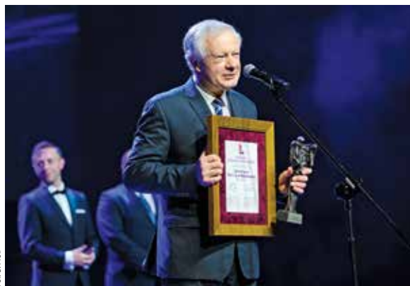
← W lutym 2020 r. UMCS otrzymał tytuł Ambasadora Województwa Lubelskiego

W latach 2012–2020 dużej zmianie uległa polityka medialna prowadzona w Uczelni, co z kolei przełożyło się na zmianę jej wizerunku zarówno wewnątrz instytucji, jak i na zewnątrz. UMCS zaczął być pozytywnie postrzegany przez media nie tylko regionalne, ale i ogólnopolskie. Z pewnością wpływ na to miały organizowane regularnie konferencje prasowe i briefingi, m.in. w związku z: Inauguracją Roku Akademickiego, powołaniem TV UMCS, konferencjami „Studenci zagranicznicy w Polsce”, organizacją XII edycji Lubelskiego Festiwalu Nauki, obchodami jubileuszów 70. i 75-lecia UMCS-u, bogatym programem 150. rocznicy urodzin Marii Curie-Skłodowskiej (której towarzyszył przyjazd wnuków Patronki Uniwersytetu) czy z wizytami Ministra Nauki i Szkolnictwa Wyższego, informującego opinię o środkach przekazanych uczelni na budowę Kampusu Zachodniego UMCS. Podczas tego typu