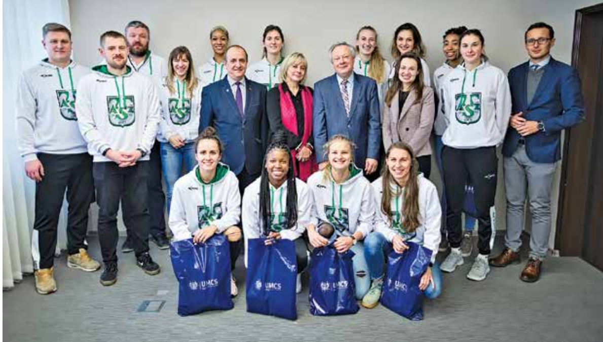
← Spotkanie z zespołem Pszczółka Polski Cukier AZS UMCS Lublin (styczeń 2020)

ten sekcji koszykówki kobiet – Pszczółka Polski Cukier AZS UMCS Lublin. Drużyna występuje w ekstraklasie nieprzerwanie od sezonu 2014/2015. W 2016 r. sięgnęła po Puchar Polski, co jest największym sukcesem zespołu. W zmaganiach ligowych historyczne były rozgrywki 2019/2020, kiedy to akademicki uplasowały się na 4. miejscu i nie mogły podjąć rywalizacji ze względu na pandemię.