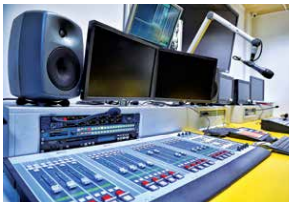
Inkubator Medialno-Artystyczny wyposażony jest w nowoczesny sprzęt →

dzi w obszar kultury. Tak samo jak cały świat idzie do przodu, tak również kultura studencka zmienia się razem z rozwojem technologii. Wciąż jednak pozostaje specyficzna i jedyna w swoim rodzaju, bo jest szczerą, autentyczną i ciekawą.