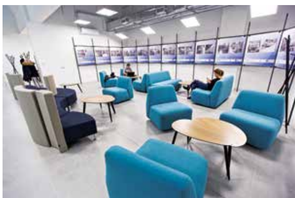
Wnętrze stołówki akademickiej „Trójki” →