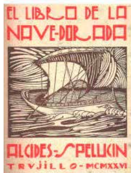
Revistas Iris y Perú . Derecha: poemarios de Vallejo y Spelucín