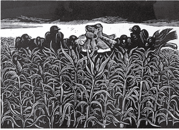
Carlos Bernasconi. Xilografía, 1976