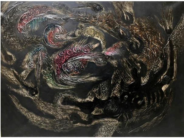
J. Piqueras. Coincidencia fantástica . Técnica mixta, 1960