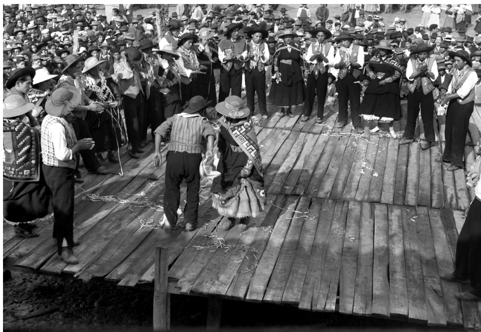
Bailando el huaylas. Huancayo, hacia 1950