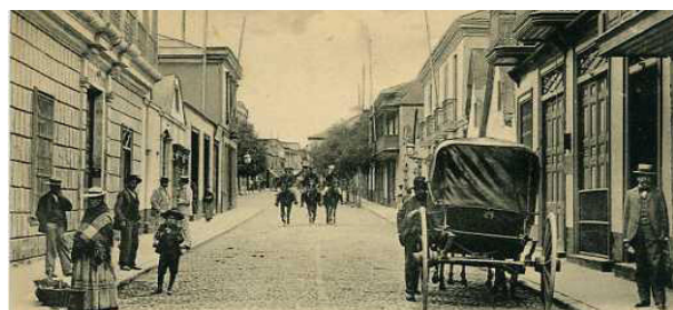
Tacna, calle San Martín, hacia 1920

La vigencia de Perú: problema y posibilidad , invita a responder si aún es asumible, parafraseando a Alberto Flores Galindo, la terca apuesta por el sí de Basadre. Para emprender este ejercicio reflexivo se ha seleccionado solo algunos de los variados temas abordados por este intelectual peruano en su emblemática obra de 1931. Estos son: la obligatoriedad de formular un proyecto descentralista regionalmente consensuado como solución al centralismo limeño, la necesidad de superar los vacíos y fracasos del