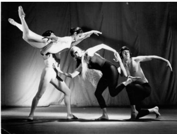
Contrastes, coreografía de Armando Barrientos. Ballet de San Marcos, 1970