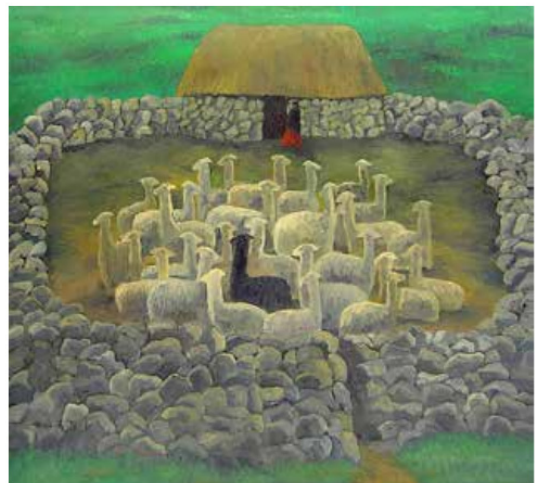
Cornal de alpacas. Óleo sobre tela, 2004

tra colectivas y bienales. Precisamente, una muestra itinerante de sus grabados se expuso el año pasado en la Casa de América de Madrid. A propósito de su pintura, el artista Fernando de Szyszlo señaló: «Encuentro que hay en esos cuadros una sensación muy profunda del paisaje y una vocación de utilizarlo plásticamente, ya sea contrastando formas sólidas y agresivas contra el espacio vacío, o usando la sensación dramática de pequeñas figuras en espacios ilimitados».