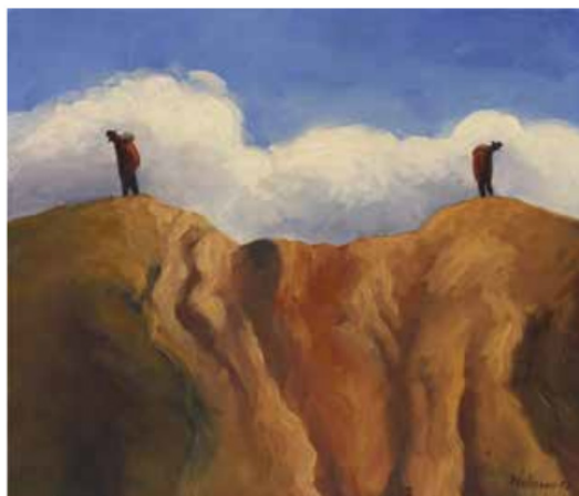
De cerro a cerro. Óleo sobre tela, 2012

Sus años de estudio en Europa y en Japón han sido sin duda decisivos en la composición de sus obras. Solorio asegura que su convencimiento de que la concepción del arte japonés es muy diferente a la del arte europeo fue absolutamente revelador en su etapa formativa. Liberado de las convenciones de la belleza tradicional, Solorio empezó a realizar su trabajo sobre un entramado compositivo de líneas rectas donde las eventuales curvas solo sirven como vectores secundarios, elementos para ilustrar el movimiento interior en un universo cuya majestad está en su infinita persistencia. Esta gravitante inmensidad, esta abrumadora quietud detrás de todo movimiento, se traduce en Solorio en una obra marcada por la serenidad y la evocación de un lugar -un otro lugar- existente en alguna parte del alma del pintor.