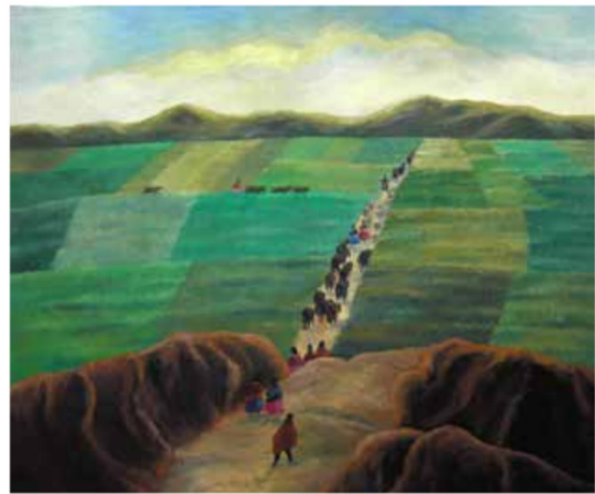
Cancha Achaya. Óleo sobre tela, 2005

De vuelta al Perú, se estableció en Arequipa y fue profesor de la Escuela de Arte de la Universidad Nacional de San Agustín. En 1989, expuso en Lima, en el Museo de Arte Italiano, una numerosa serie de pinturas y xilografías. Pasó luego otra temporada en Suiza, esta vez en Basilea, donde siguió en el Basler Papiermühle un curso de fabricación artesanal de papel, que sigue produciendo y emplea en la impresión de su obra gráfica. En las últimas dos décadas, Solorio ha ejercido un magisterio personal en su taller, convirtiéndose en un referente para los nuevos grabadores de la región. Ha realizado numerosas exposiciones individuales y ha participado en mues-