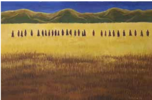
Collana pampa. Témpera sobre papel, 2018