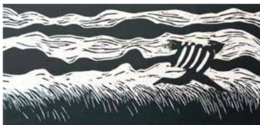
Padre viento. Xilografía, 2017

Su obra parece suspendida en un tiempo mítico. Esta actitud introspectiva ha tensado su trabajo formal desde un evidente trazo figurativo hacia el horizonte de lo abstracto. En la obra de Solorio hay un afán de síntesis, de búsqueda de esa precisa combinación de formas que lo originan todo. El discurso de Solorio no es triste, ni siquiera melancólico. Parece impresionado por el espacio que hay entre la cima y la sima. Lo inmenso se percibe al colocar en escala lo minúsculo, la figura humana.