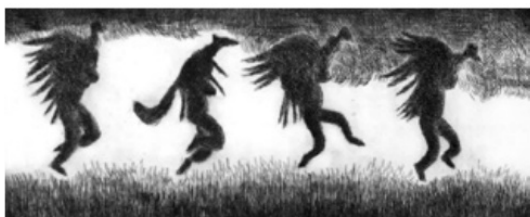
Córdones y zorro. Aguafuerte, 2010

Lo primero que llama la atención en la obra de Luis Solorio es la limpieza de su composición y lo hierático de su propuesta. La temática de Solorio son los campesinos. Es un tema muy frecuentado por artistas plásticos andinos de la primera mitad del siglo xx. Pero la visión de este artista peruano es original, en primer lugar, porque no hay ese viejo romanticismo ni alguna manoseada doctrina en su mirada. En segundo lugar, porque los campesinos que le interesan no son los de valles regados por pintorescos ríos turbulentos, sino aquellos que viven en rocosas alturas, donde es escaso el oxígeno, y lo elemental está extrañamente activo.