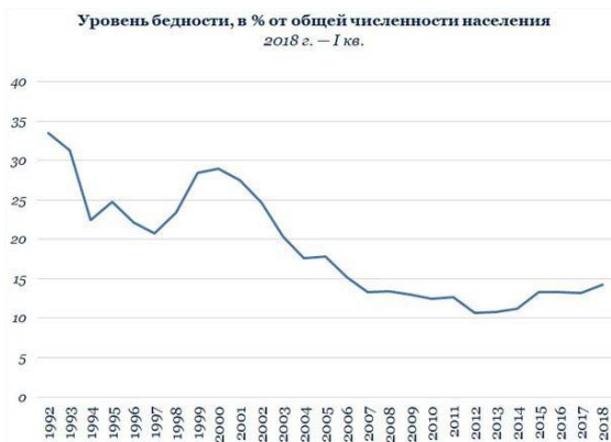
Таблица 1. Динамика уровня бедности в России (1992–2018 г.г.)