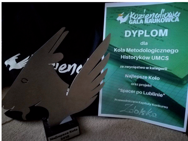
Fot. 5. Kozienaliowy Festiwal Nauki 2018

W maju 2018 r. członkowie Koła gościli na uroczystej Kozienaliowej Gali Naukowca , podczas której zostali uhonorowani statuetką i dyplomem Najlepszego Koła 2018 oraz wyróżnieni za projekt Spacer po Lublinie . Po raz kolejny uczestniczyli też w Lubelskim Festiwalu Nauki 2018. Tegoroczne jego hasło brzmiało: „Człowiek inspiracją nauki” – jego treść stanowi także credo Koła Metodologicznego Historyków.