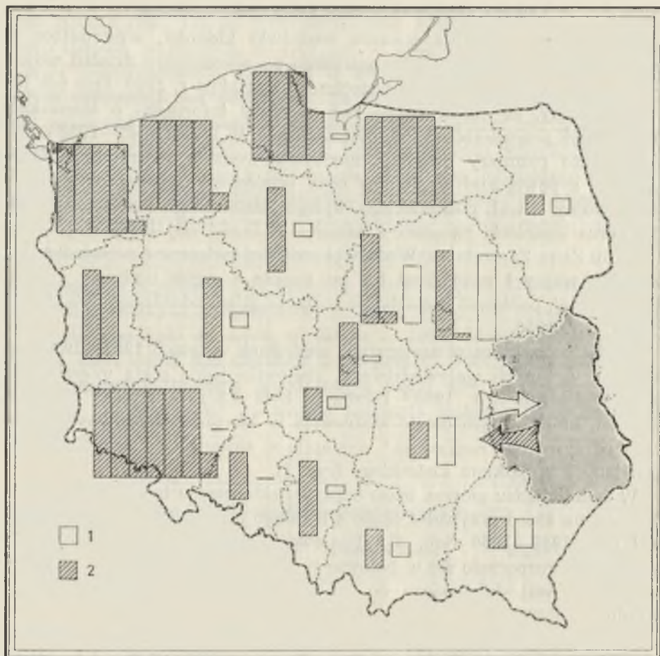
Ryc. 1. Międzywojewódzkie wędrówki ludności woj. lubelskiego w latach 1939—1950 wg danych spisowych Intervovodeship migrations of the Lublin voivodeship population, 1939—1950, according to the census of 1950

ludności napływowej do danego województwa. W niektórych bowiem przypadkach napływ z zagranicy, potraktowany łącznie z napływem z kierunków nie ustalonych, sięgał połowy całego napływu w tym okresie (woj. opolskie, zielonogórskie, katowickie). 7