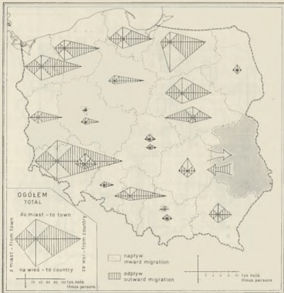
Ryc. 6. Kierunki i natężenie międzywojewódzkich wędrówek ludności woj. lubelskiego w latach 1951—1960 wg danych spisowych Directions and intensity of intervoivodeship migrations of the Lublin voivodeship population, 1951—1960, according to the census of 1960

międzywojewódzkiej, który jednak nie jest w pełni porównywalny z obrazem uzyskanym w oparciu o materiały spisowe.