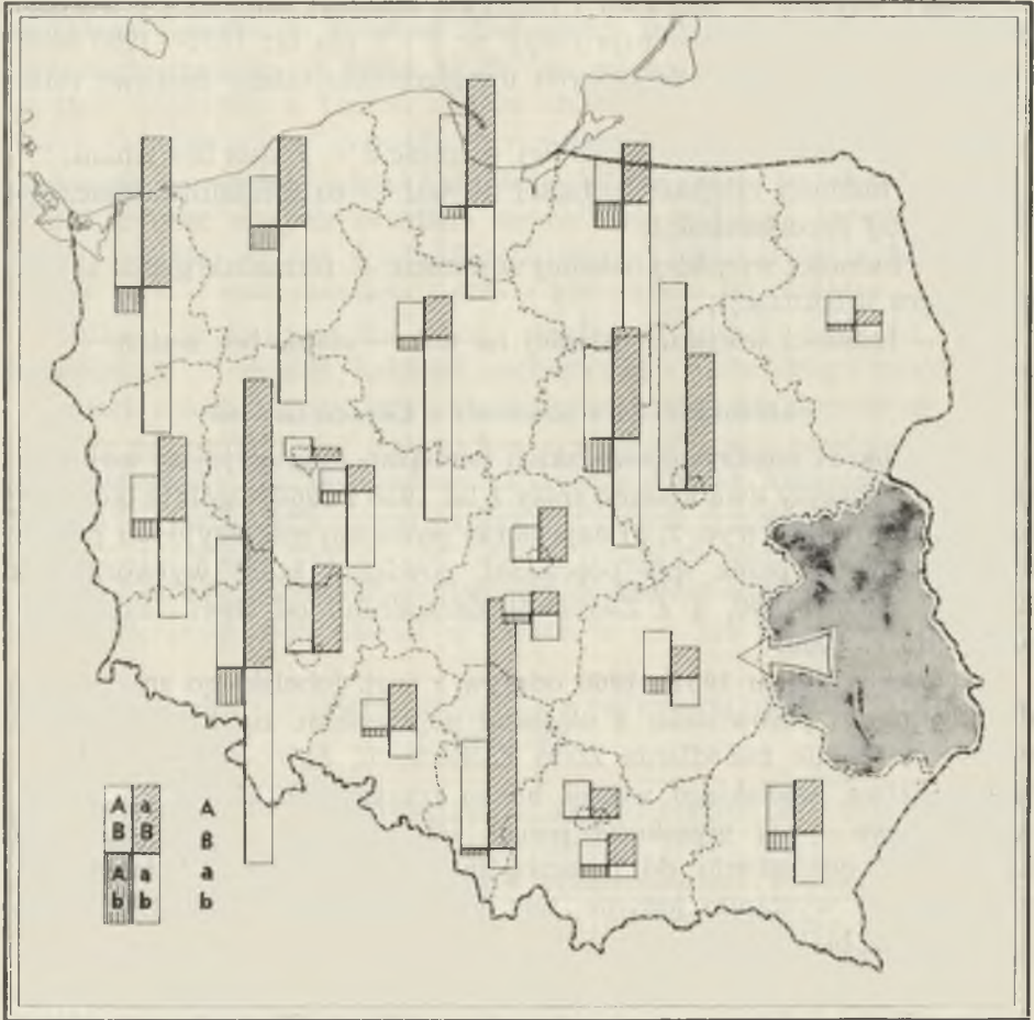
Ryc. 2. Odpływ ludności z woj. lubelskiego w latach 1951—1960 wg danych spisowych; A — z miast, a — ze wsi, B — do miast, b — na wieś

Emigration from the Lublin voivodeship, 1951—1960, according to the census of 1960; A — from town, a — from country, B — to town, b — to country