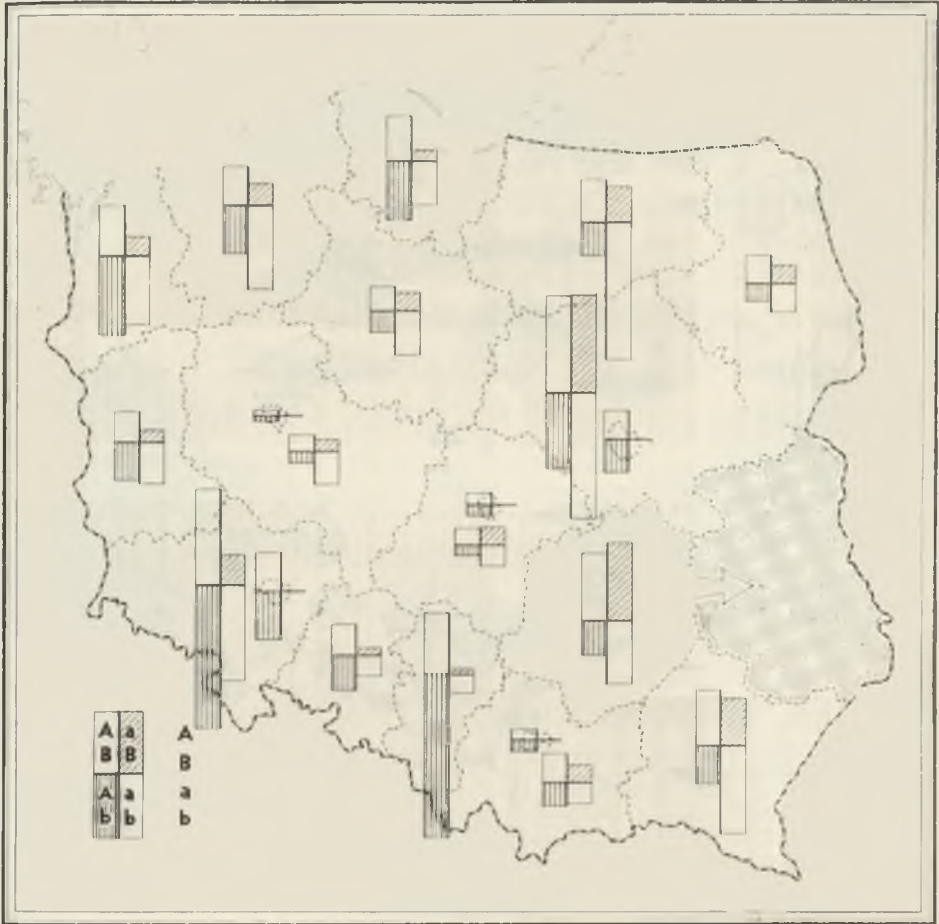
Ryc. 5. Napływ ludności do woj. lubelskiego w latach 1961—1970 (w świetle sprawozdań o ruchu wędrownym); A — z miast, a — ze wsi, B — do miast, b — na wieś

Immigration to the Lublin voivodeship, 1961—1970, according to registration data; A — from town, a — from country, B — to town, b — to country