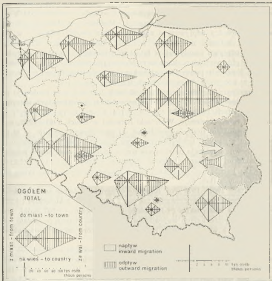
Ryc. 7. Kierunki i natężenie międzywojewódzkich wędrowek ludności woj. lubelskiego w latach 1961—1970 (w świetle sprawozdań o ruchu wędrownym ludności) Directions and intensity of intervoivodeship migrations of the Lublin voivodeship population, 1961—1970, according to registration data

tecznego miejsca osiedlenia się. Osoba zmieniająca województwo zamieszkania w latach międzyspisowych może kilkakrotnie zmienić miejsce (województwo) pobytu, zanim przeprowadzony zostanie następny spis ludności. W sprawozdawczości o ruchu wędrownym ujęte zostanie każde wymeldowanie i zameldowanie; spis zarejestruje tylko pierwsze wymeldowanie i ostatnie zameldowanie, i tylko wtedy, gdy dana osoba nie powróciła do województwa wyjściowego, tj. miejsca pobytu w czasie poprzedniego spisu.