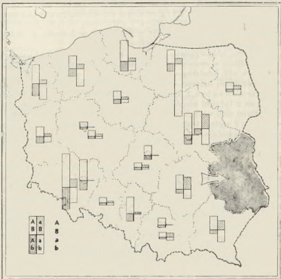
Ryc. 3. Napływ ludności do woj. lubelskiego w latach 1951—1960 wg danych spisowych; A — z miast, a — ze wsi, B — do miast, b — na wieś Immigration to the Lublin voivodeship, 1951—1960, according to the census of 1960; A — from town, a — from country, B — to town, b — to country

wilejowane miejsce zajęło woj. wrocławskie. Przypadło na nie blisko 14% ludności, która w latach międzyspisowych wywędrowała z województwa lubelskiego. Natomiast województwa zielonogórskie i opolskie, gdzie poprzednio ludność z woj. lubelskiego osiadła w znikomym procencie, także teraz nie wykazały silniejszych powiązań.