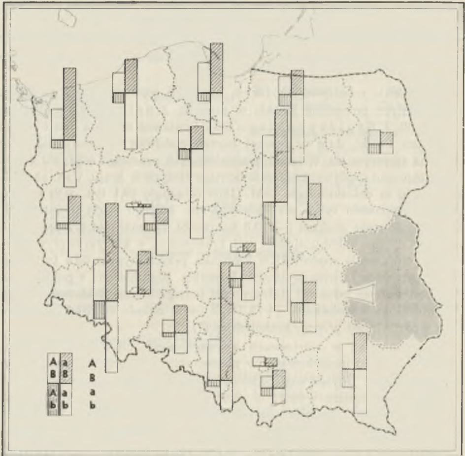
Ryc. 4. Odpływ ludności z woj. lubelskiego w latach 1961—1970 (w świetle sprawozdań o ruchu wędrownym); A — z miast, a — ze wsi, B — do miast, b — na wieś

Emigration from the Lublin voivodeship, 1961—1970, according to registration data; A — from town, a — from country, B — to town, b — to country