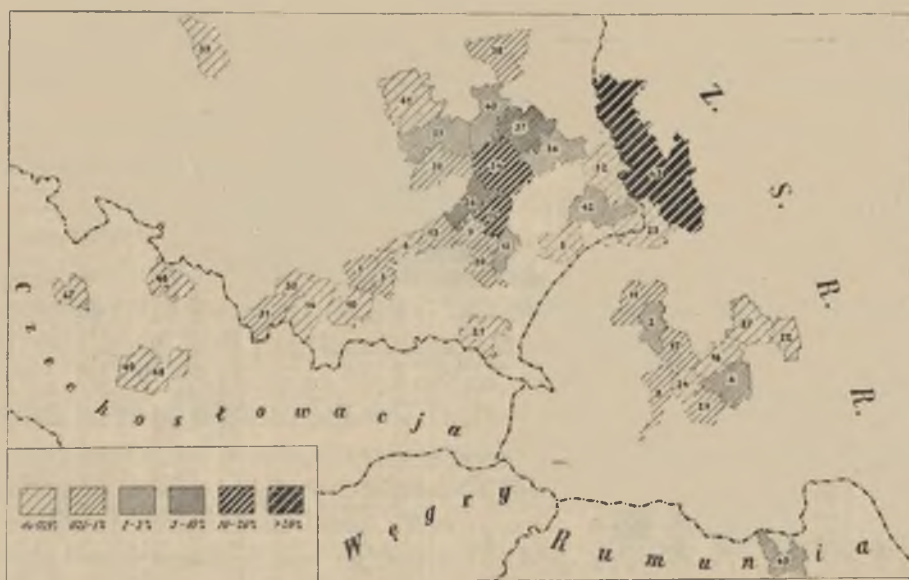
Ryc. 2. Powiaty ostatniego pobytu ludności Nowego Martyńca. The districts of last dwelling of the inhabitants of Nowy Martyniec.

Na stały wzrost elementu polskiego w Bośni składał się nie tyle przyływ nowych sił z zewnątrz, lecz przede wszystkim duży przyrost natu-