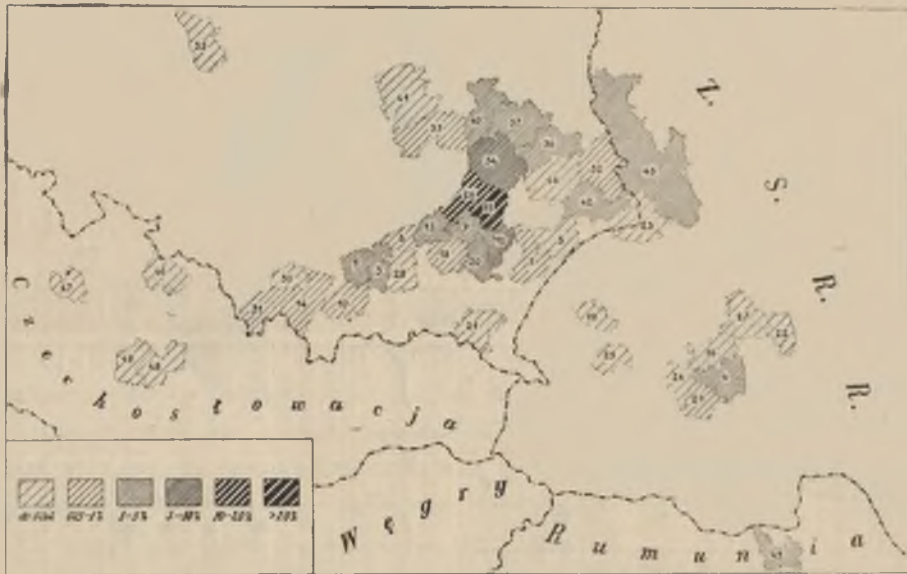
Ryc 1. Powiaty urodzeń ludności Nowego Martyńca.

Porównanie obu map pozwala na uchwycenie procesu emigracyjnego bezrolnych i małorolnych, którzy emigrowali z byłej Galicji do przyległych powiatów województwa lubelskiego oraz na Wołyń. Pewna ilość przybyłych do tych obszarów wchodziła w związki małżeńskie z ludnością miejscową, a gdy nadszedł okres emigracji do Bośni, z elementem uro-