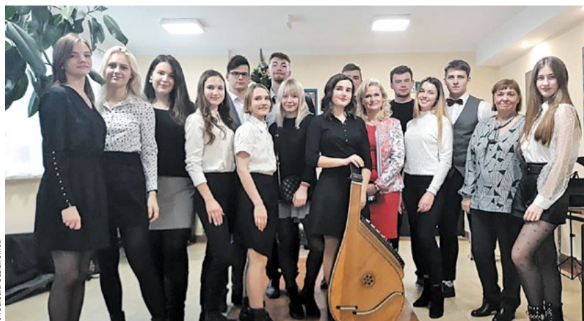
Fot. Barbara Guziuk-Świca