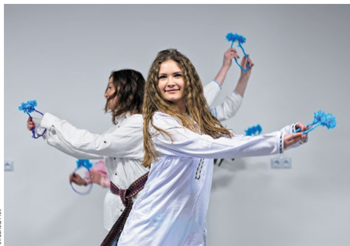
Fot. Barrose Profil