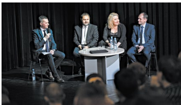
Autorzy książki podczas spotkania →