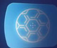
Przerwa w grze