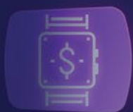
Akademycki Kwadrans Przedsiębiorczości