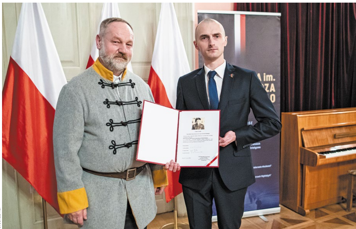
Fot. Bartosz Profil