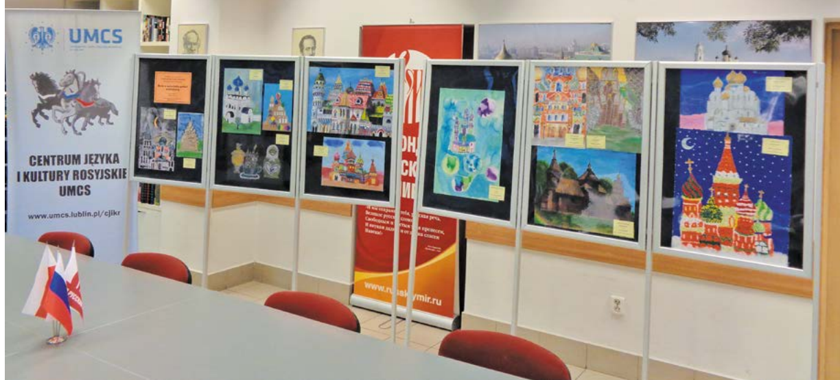
Część wystawy prac uczniów →