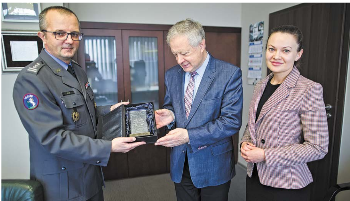
Fot. Barbos Profl