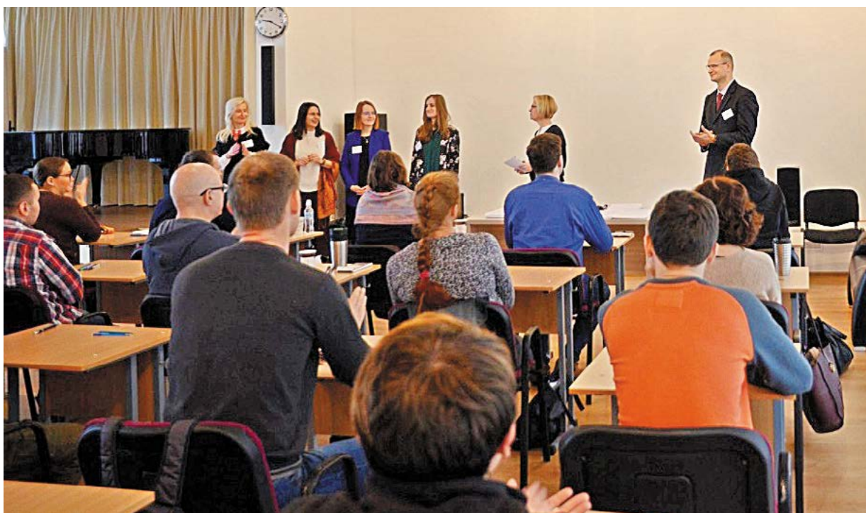
Fot. Elena Grondzil