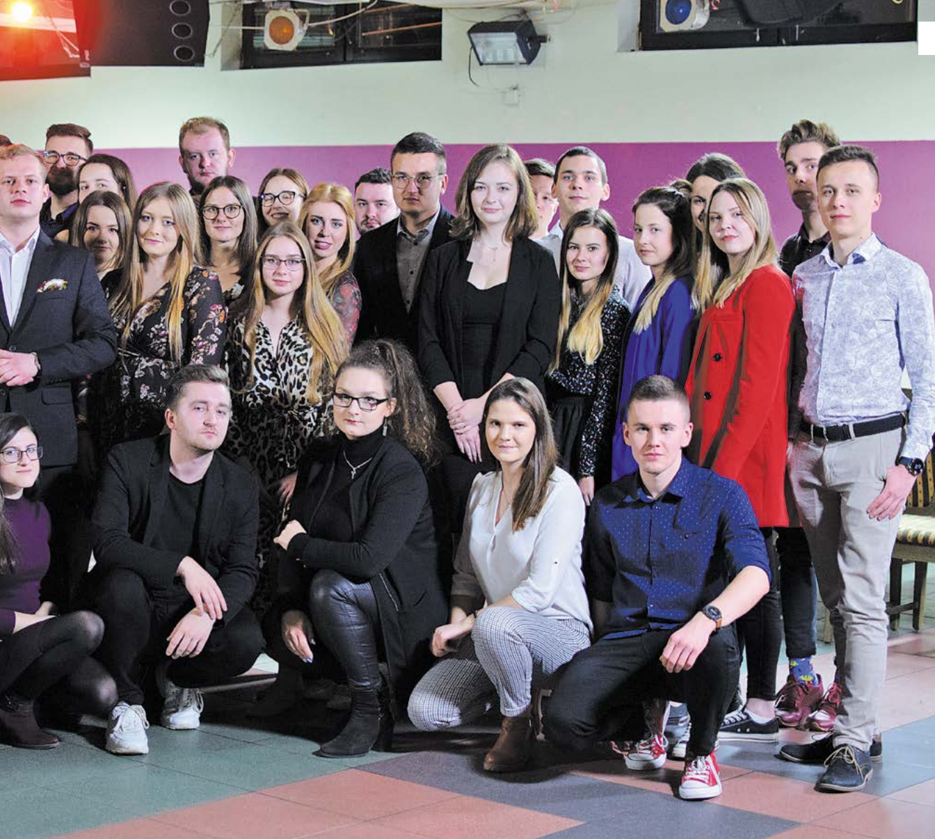
← Uczestnicy Akademii samorządowca

śmy przekonani, że Akademia Samorządowca to kolejny krok do jeszcze lepszej współpracy z Samorządami Wydziałowymi naszego Uniwersytetu.