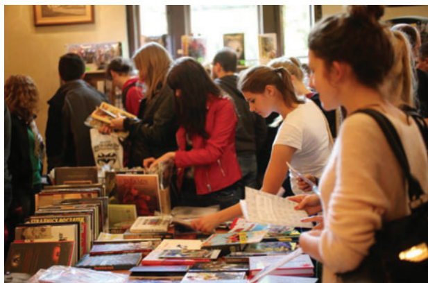
II. 4. Dzień Darmowego Komiksu 2014

Wyjątkowym projektem na skalę Poznania, a także Polski, jest Poznańska Dyskusyjna Akademia Komiksu (PDAK). Są to spotkania dla osób zainteresowanych komiksem i tych, którzy chcą go poznać z innej, ciekawszej strony, podczas których ścierają się odmienne poglądy, widziane z różnych perspektyw naukowych. Organizatorami są Biblioteka Uniwersytecka w Poznaniu oraz Fundacja Tranzyt w ramach projektu Centrala – Sztuka Komiksu Europy Środkowej. Wydarzenie to odbywa się raz w miesiącu i gromadzi każdorazowo ok. 30 uczestników. Prelegentami są wykładowcy i nauczyciele akademicy z różnych obszarów: filmoznawcy, filolodzy, językoznawcy, historycy, którzy pokazują jakiś obszar komiksu w pryzmacie swoich badań. PDAK to kontynuacja współpracy między Centralą a Biblioteką Uniwersytecką po wspólnie zorganizowanej w 2009 r. wystawie Komiks za żelazną kurtyną . Efektem tych działań jest m.in. publikacja serialu obrazkowego Henryka Derwicha Tajemnice Poznania czy Dzień Darmowego Komiksu, w którym uczestniczyło blisko 700 osób. Zaprezentowano ponad 6 tys. tytułów komiksów, zorganizowano stoiska z darmowymi komiksami i czasopismami komiksowymi, odbyło się 5 wykładów, a wśród gości pojawili się cosplayerzy, czyli postacie przebrane za bohaterów komiksów.