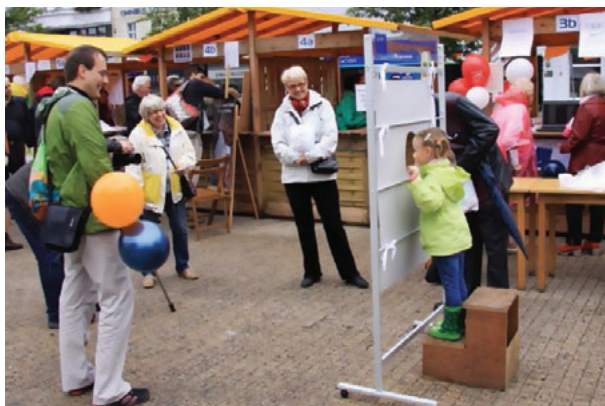
Il. 7. IV Poznański Dzień Organizacji Pozarządowych

Kruszewski, stara się, aby biblioteczna przestrzeń „wchodziła” do środowiska społecznego, adaptowała się do nowych potrzeb; realizuje zatem koncepcję „żyjącej biblioteki” 18 .