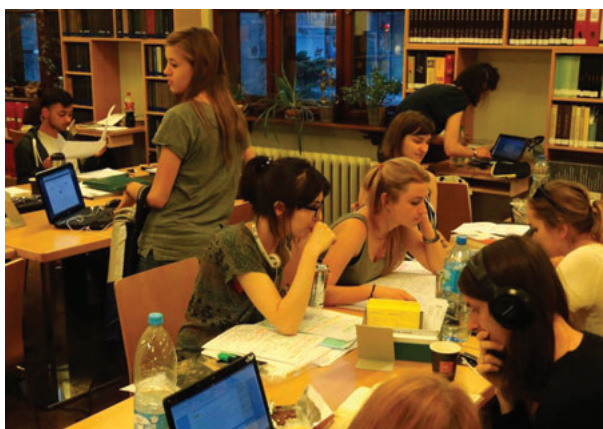
Il. 9. Nocne rendez-BU