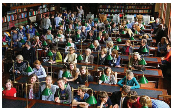
Il. 2. Wykład otwarty podczas Poznańskiego Festiwalu Nauki i Sztuki

Biblioteka nie zapomina w tym czasie o swoim środowisku, świętując uroczystości Dzień Bibliotekarza czy zapraszając na wykłady naukowe osoby związane z działalnością bibliotek, wydawnictwami, prawem bibliotecznym itp. Tydzień Bibliotek kończy „Wieczór w Bibliotece” z koncertami i występami artystycznymi.