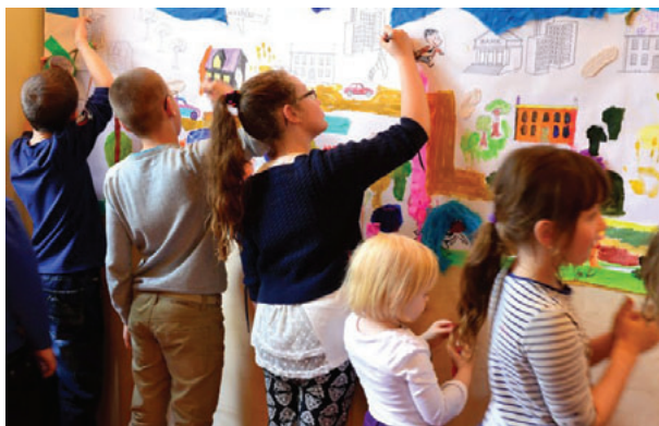
Il. 6. Warsztaty wyobraźni

Kruszewski, stara się, aby biblioteczna przestrzeń „wchodziła” do środowiska społecznego, adaptowała się do nowych potrzeb; realizuje zatem koncepcję „żyjącej biblioteki” 18 .