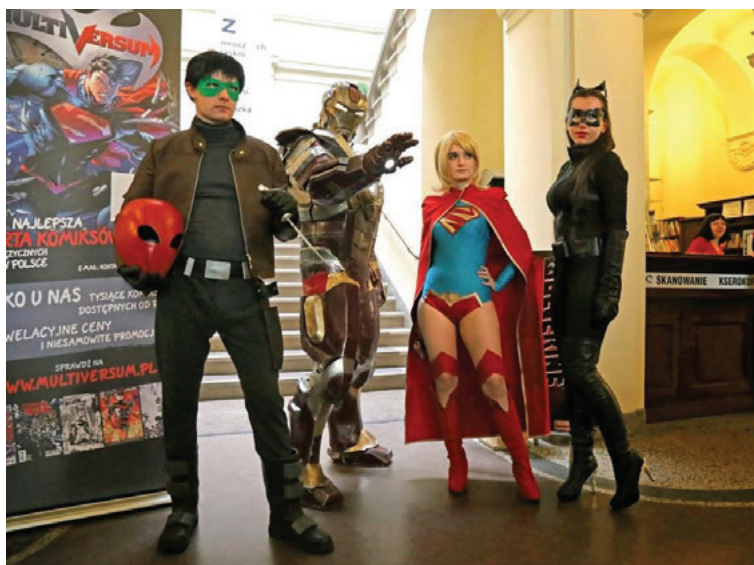
Il. 5. Cosplayerzy w Bibliotece Uniwersyteckiej podczas Dnia Darmowego Komiksu

Biblioteka Uniwersytecka dąży do tego, aby przestrzeń biblioteczna służyła nie tylko celom stricto naukowym, ale aby była także tzw. trzecim miejscem 16 . Pobyt w bibliotece nie powinien kojarzyć się tylko z trudem prowadzonych badań, ale ma mieć również charakter towarzyski, tak aby stworzyć dobre relacje między odwiedzającym a placówką 17 . Jeszcze do niedawna tendencją obowiązującą na Uniwersytecie było kierowanie działań wyłącznie do środowiska akademickiego. Prace nad strategią, tematyka projektów grantowych i wiążąca się z tym możliwość dofinansowania różnego rodzaju działań spowodowały „otwarcie” się Uczelni na nowych zasadach i na nowe środowiska. Przykładem tego jest powstanie Kolorowego Uniwersytetu, skierowanego do dzieci szkół podstawowych. Wydziały Uniwersytetu im. Adama Mickiewicza w Poznaniu są gospodarzami wykładów i w ten sposób dzieci zapoznają się z całą Uczelnią – uczeni przekazują dzieciom swoją wiedzę, dzieci zaś swój zapał i pozytywną energię.