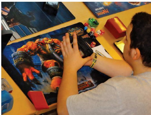
II. 8. W Bibliotece wszystko gra!