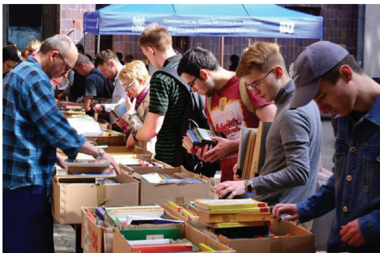
Il. 3. Tydzień Bibliotek. Kiermasz książek – Dajmy książkom drugie życie

Biblioteka nie zapomina w tym czasie o swoim środowisku, świętując uroczystości Dzień Bibliotekarza czy zapraszając na wykłady naukowe osoby związane z działalnością bibliotek, wydawnictwami, prawem bibliotecznym itp. Tydzień Bibliotek kończy „Wieczór w Bibliotece” z koncertami i występami artystycznymi.