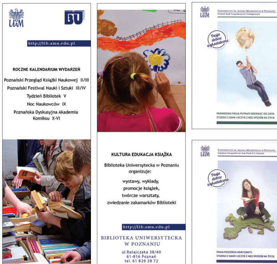
Il. 1. Projekt ulotki przygotowanej przez BU oraz Dział Promocji i Marketingu UAM z uwzględnieniem zasad SIW UAM

Współpraca Biblioteki z Działem Promocji i Marketingu UAM przebiega bezkonfliktowo, a decyzje dotyczące projektów są zatwierdzane i realizowane błyskawicznie. Dotyczy to nie tylko omawianych materiałów reklamowych, ale także współdziałania w organizowaniu imprez, np. Nocy Naukowców, Festiwalu Nauki i Sztuki czy Wielkiej Majówki. Biblioteka promuje swoje różnorodne działania, a Uniwersytet wspiera ją w kontaktach z poznańskimi mediami. Informacje o wszystkich działaniach przekazywane są do Biura Prasowego oraz Działu Promocji i Marketingu UAM za pośrednictwem bibliotecznego koordynatora Uniwersyteckiego Systemu Informacji (USI).