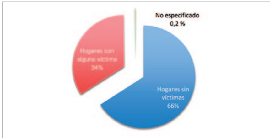
Gráfica 2. Hogares con alguna víctima de delito. 2013

Otra importante propuesta del presidente Peña Nieto, derivada de la crisis de Iguala, fue la reforma de Seguridad y Justicia, presentada el 28 de noviembre de 2014. La propuesta presidencial incluye el cambio de siete artículos de la Constitución –21, 73, 104, 105, 115, 116 y 123–, por ello necesita la mayoría calificada de las dos terceras partes de los legisladores en