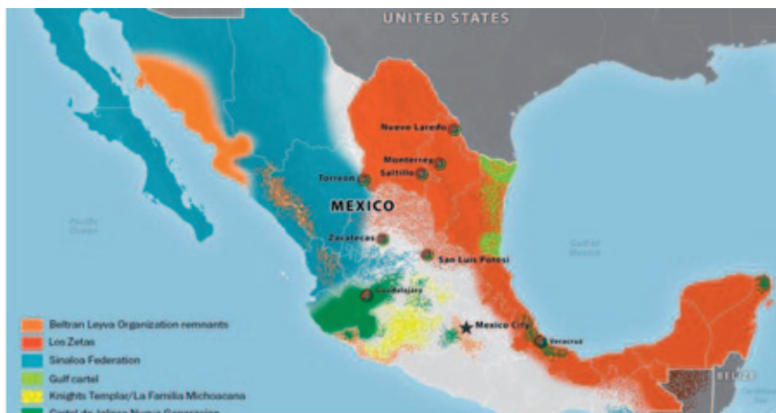
Mapa 1: Presencia geográfica del los carteles mexicanos 2013

a la masacre de 43 estudiantes en Iguala el 26 de septiembre de 2014, causando una gran crisis política estatal y nacional, además con gran repercusión internacional, por la grave violación de derechos humanos (GIEI-OEA 2015).