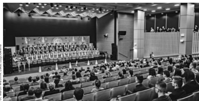
Zakaz Zdjęciowania