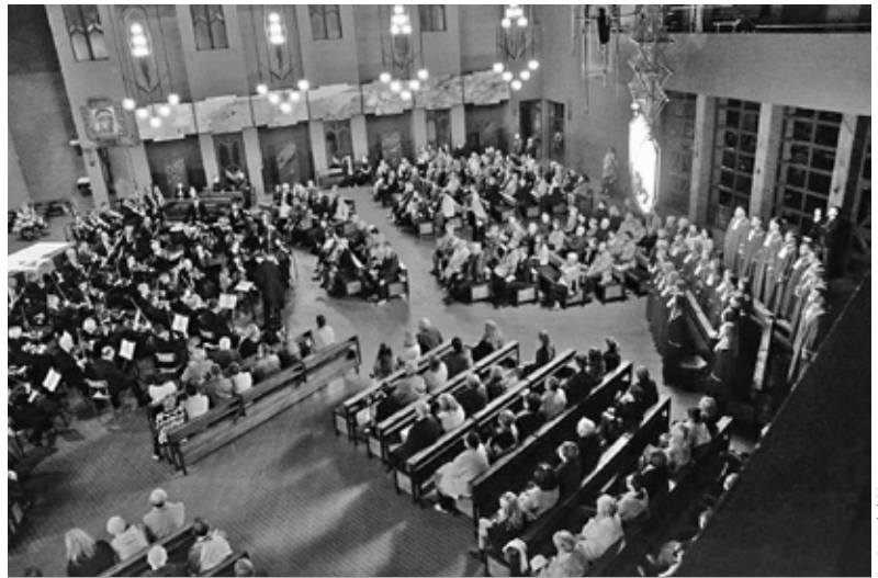
• Koncert Akademicki z udziałem Akademickiego Chóru Uniwersytetu Medycznego w Lublinie

W wrześniu wystąpił zespół kameralny Trombastic z „wędrówkami z puzonem po muzyce od renesansu