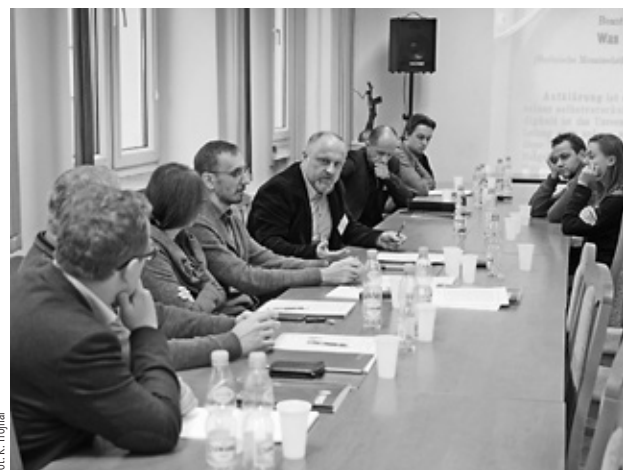
• Podczas obrad