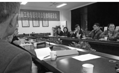
• Seminarium naukowe w Collaborative Innovation Center of Yangtze River Delta Region Green Pharmaceuticals

do poprowadzenia tematycznych sesji referatowych.