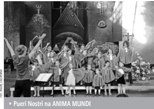
• Pueri Nostris na ANIMA MUNDI