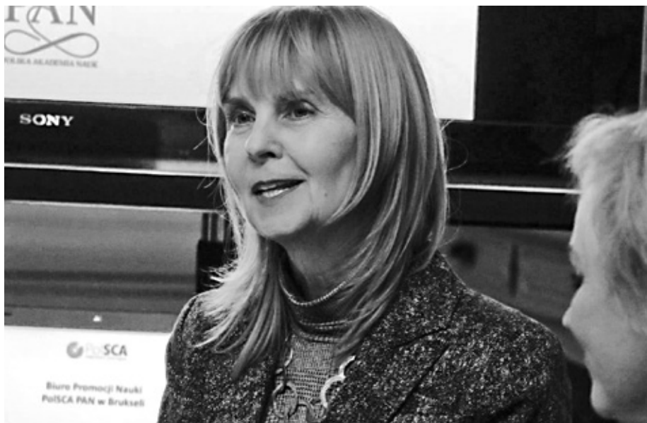
Fot. Mateusz Kasiak i Artur Godziszewski