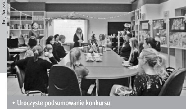
• Uroczyste podsumowanie konkursu