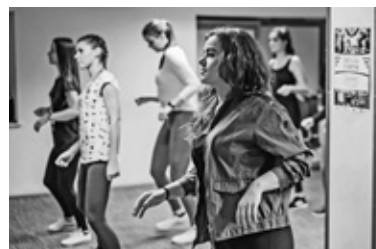
Fot. Marcin Wiechlik: Zakaz Zdjęciowania

tak ważnym jak pomaganie innym. My jednak chcieliśmy połączyć te dwie rzeczy i udało się! 13 grudnia przy współpracy z Centrum Kultury Fizycznej UMCS przeprowadziliśmy Mini-Maraton Fitness, czyli wydarzenie kierowane do studentów naszego Uniwersytetu, którzy cenią sobie aktywne spędzanie wol-