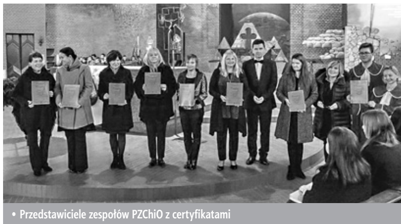
• Przedstawiciele zespołów PZChIO z certyfikatami