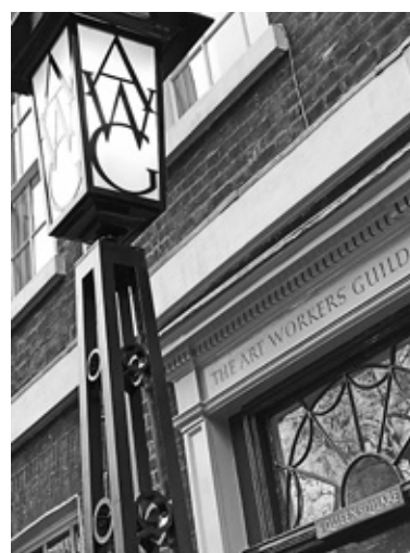
• Fragment portalu siedziby The Artworkers Guild przy Queens Square 6 w Londynie

Skanowanie przez nasz umysł tej kulturowo symultanicznej przestrzeni prowadzi do przekraczania granic racjonalności i poczucia intuicyjnego dotknięcia tajemnicy. Stąd nazwa projektu Sphinx , nawiązująca do ikony tego, co zagadkowe.