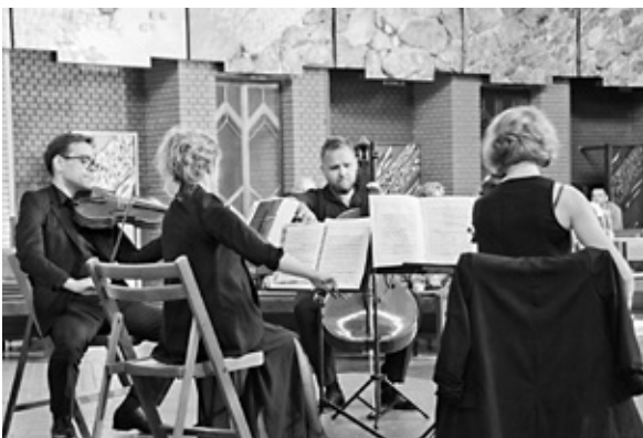
• Lato z kameralistyką