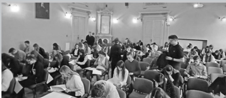
Fot. Liliana Węgrzyn-Odrobna