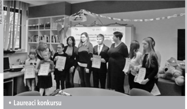
• Laureaci konkursu

dolnośląskiego, warmińsko-mazurskiego, kujawsko-pomorskiego, zachodnio-pomorskiego, łódzkiego.