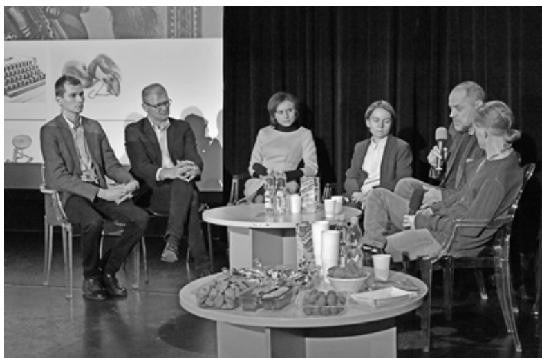
• Spotkanie z redakcją portalu internetowego ohistorie.eu