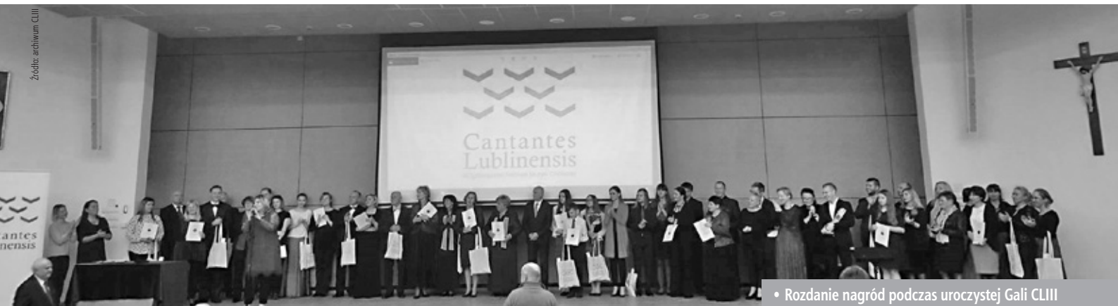
• Rozdanie nagród podczas uroczystej Gali CLIII