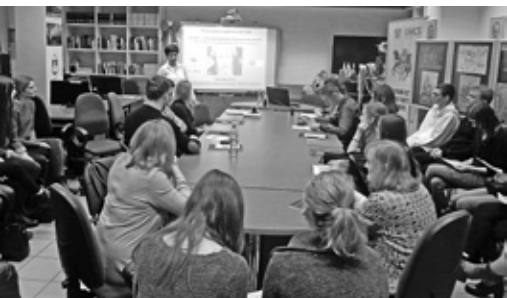
• Obrady okrągłego stołu

Jedną z tradycji Centrum Języka i Kultury Rosyjskiej UMCS jest organizacja tzw. „studenckich okrągłych stołów” – konferencji upamiętniających ważne wydarzenia historyczno-kulturalne (np. 300. rocznica urodzin uczonego-encyklopedysty Michaiła Łomonosowa, 55. rocznica otrzymania Literackiej Nagrody Nobla przez Borysa Pasternaka i in.). Jest to również doskonała okazja dla studentów, którzy mogą spróbować swoich sił w wystąpieniu publicznym na pierwszej (jak się często okazuje) konferencji.