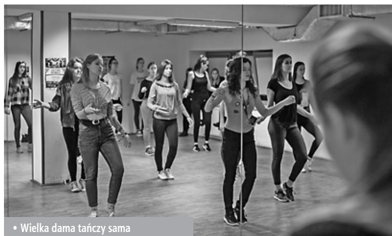
Fot. Marcin Wiechlik: Zakaz Zdjęciowania