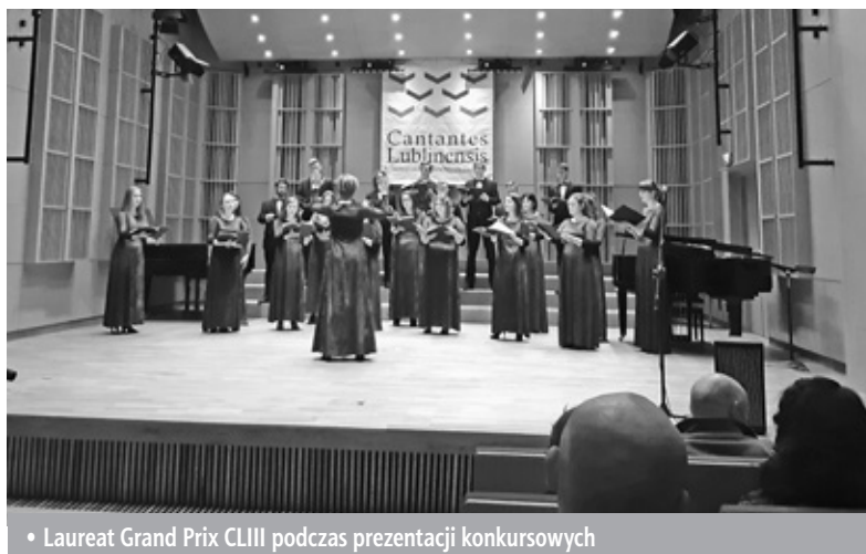
• Laureat Grand Prix CLIII podczas prezentacji konkursowych